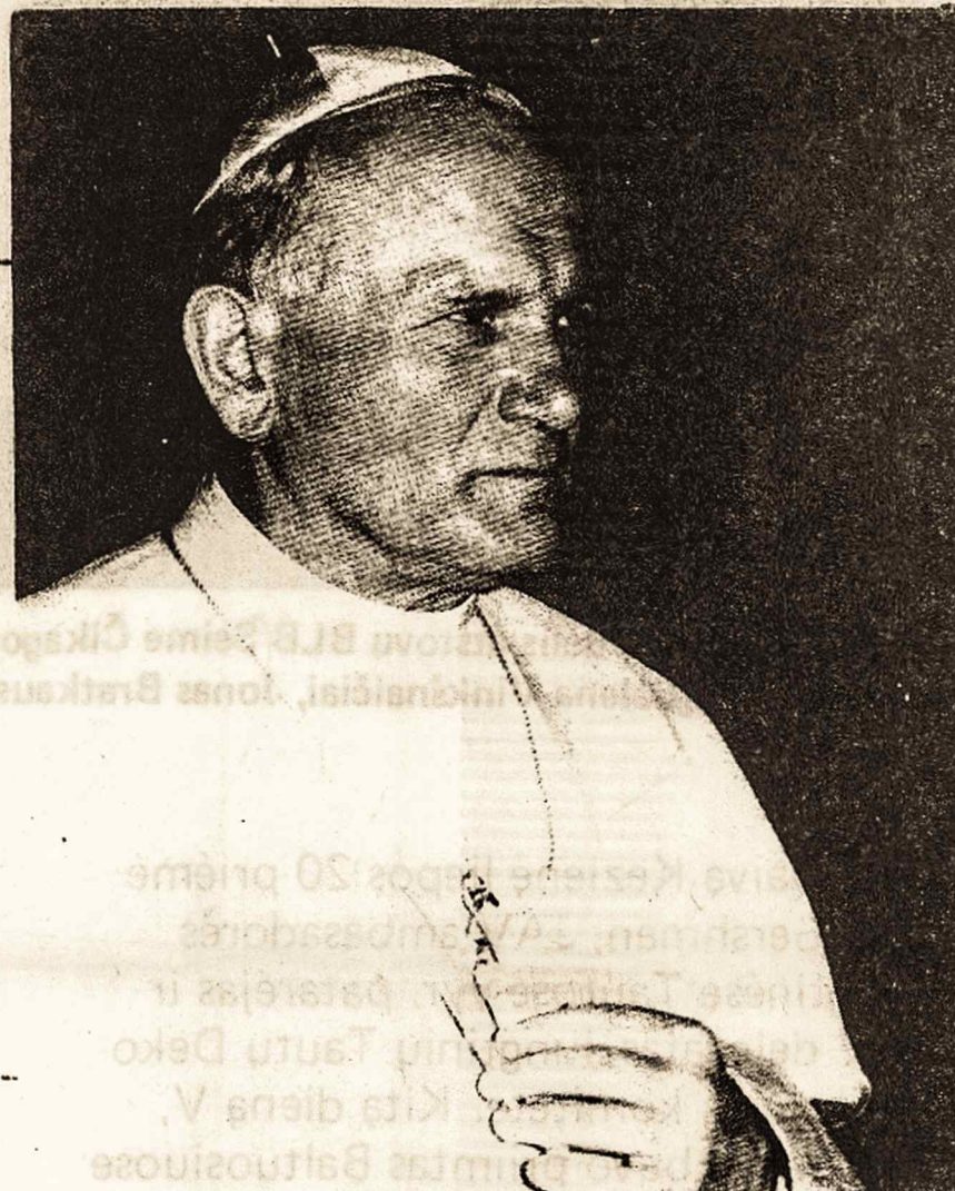
Joannes Paulus P.P. II

"Bažnyčioje garsiausiai yra girdimas apaštalu įpėdinių - vyskupų balsas, tačiau kovojančio ateizmo sąlygomis šis balsas kartais būna visiškai prislopintas. Suvokdami savo atsakomybę prieš Dievą ir Bažnyčią, taip pat žinodami, kad objektyvi informacija apie Katalikų Bažnyčios padėtį Lietuvoje nevisada pasiekdavo Apaštalu Sostą, mes, Lietuvos kunigai, ryžomės kalbėti ir ginti švenčiausias Bažnyčios ir tikinčiųjų teises, nes mūsų tyla ir laukimas sudaro palankiausias sąlygas