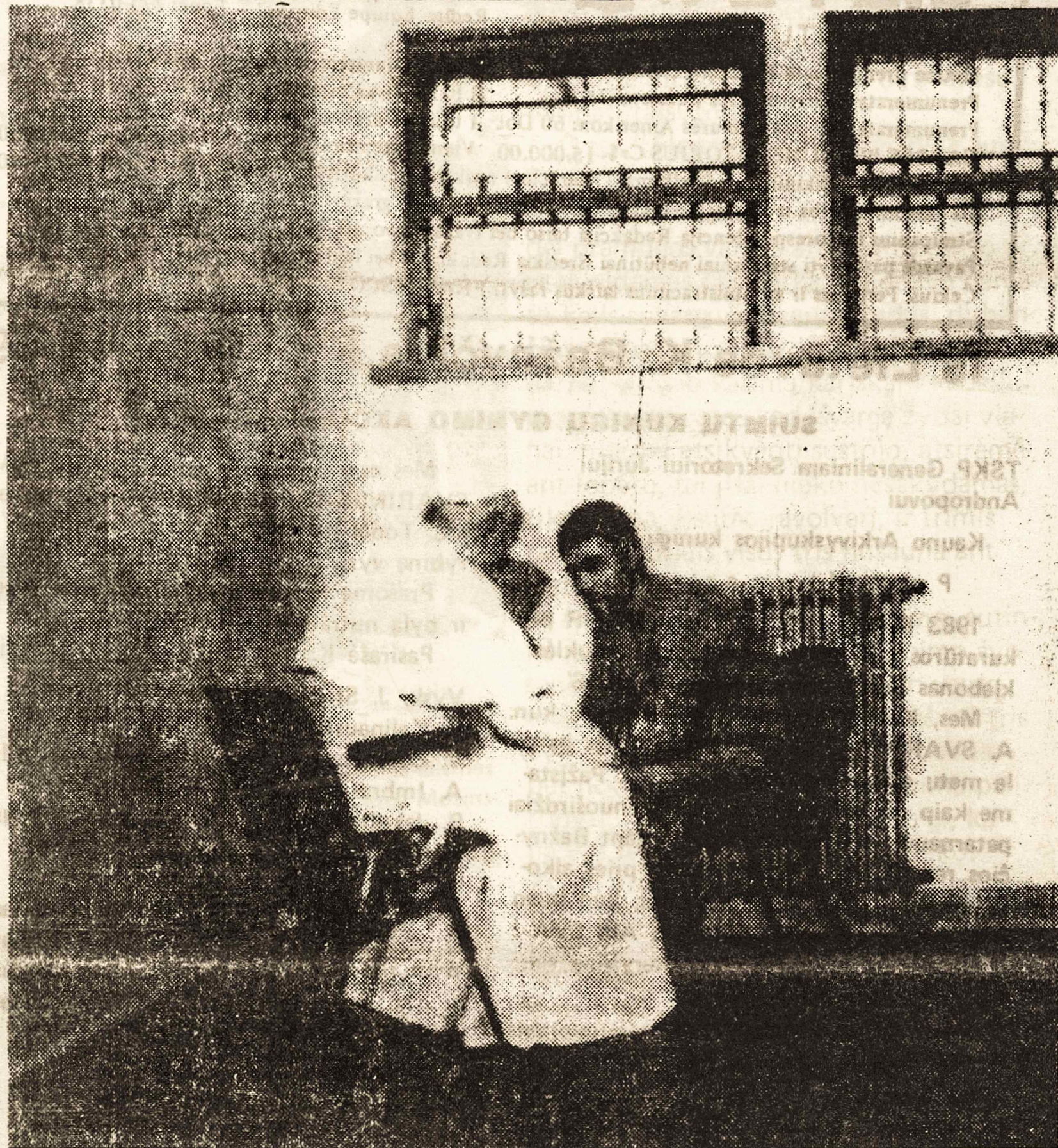
Gražus metų užbaigimo darbas: Popiežius Jonas Paulius II atleidžia mėginusiam jį nužudyti nusikaltėliui Ali Agca, kurį aplankė Romos kalėjime. KAD ŠIE 1984 METAI BŪTŲ DOVANOJIMO IR TAIKOS METAI VISIEMS.

Lietuvos prievartinė inkorporacija į Sovietų Sąjungą ir lietuvių persekiojimai krašte nuolat buvo minimi JAV Kongrese, spaudoje. Tai vyko ne tik Washingtono, bet ir tarptautiniuose forumuose: Madride Europos Saugumo ir Kooperavimo konferencijoje, Strasburge Europos Parlamente, New Yorke J.T. Organizacijos forume, kur Visumos Susirinkimo 38-sios sesijos metu III-me Komite Amerikos atstovas kalbėjo apie Baltijos valstybes ir laisvo apsisprendimo tėsę, Ženevoje, J.T. Žmogaus Teisių Komisijoje, kur JAV atstovas pabrėžė, kad "JAV nėra pamiršusios Baltijos valstybių padėties". JAV-se, Europoje 1983 metais dažniau negu anksčiau bu-