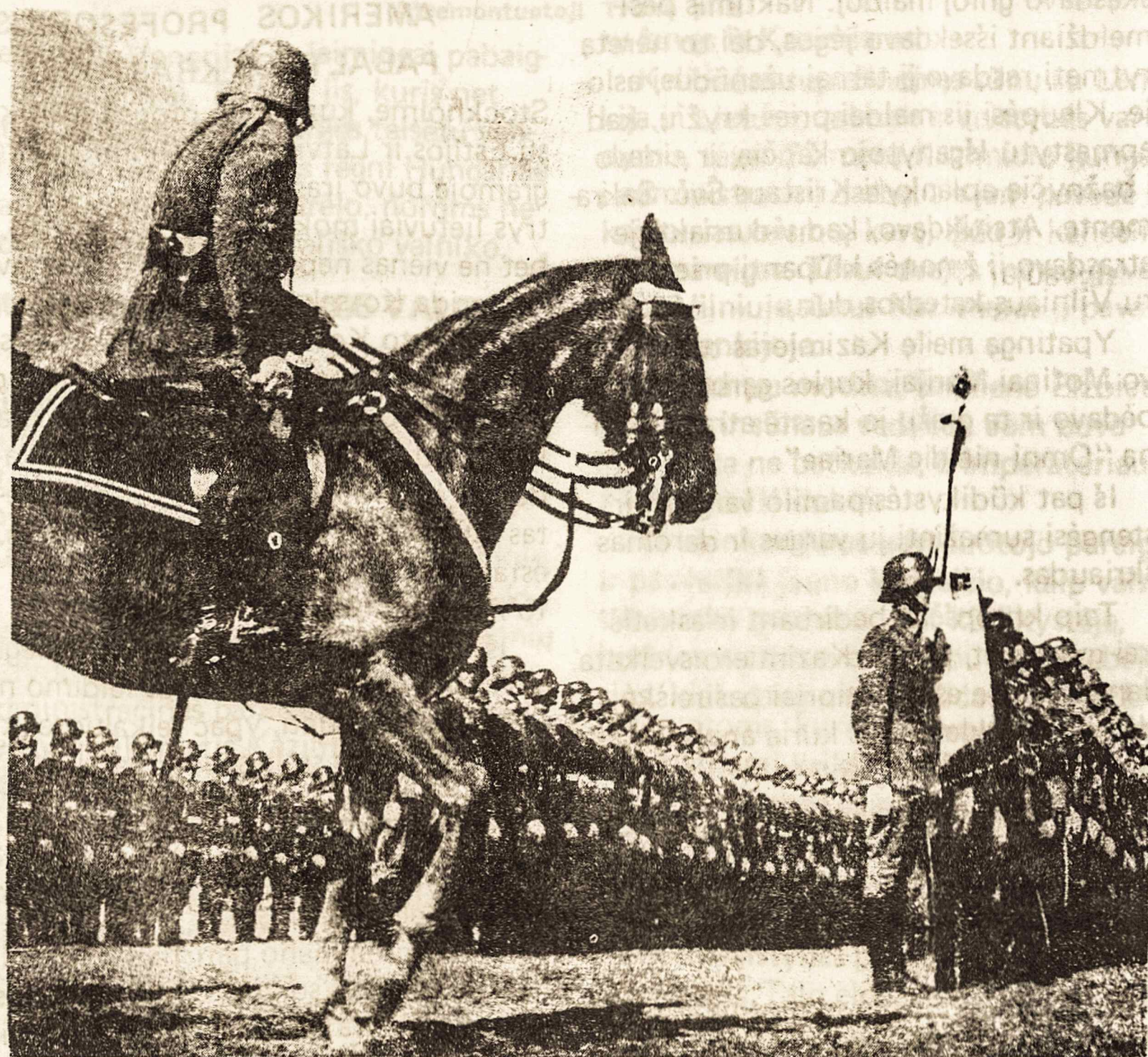
Lietuvos kariuomenė Nepriklausomybės laikais parado metu.

Labdaros Ratelis visus kviečia Mišiose dalyvauti.