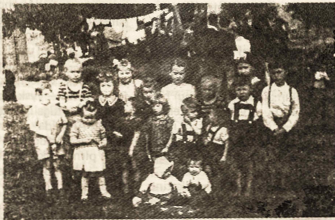
1947 metais iš Europos atvežti lietuviai, dideli ir maži, patalpinti Campo Limpo stovykloje, laukia gimių bei pažįstamų iš jos „išsilaisvinti“. Jsižiūrėję, gal atpažinsite save?