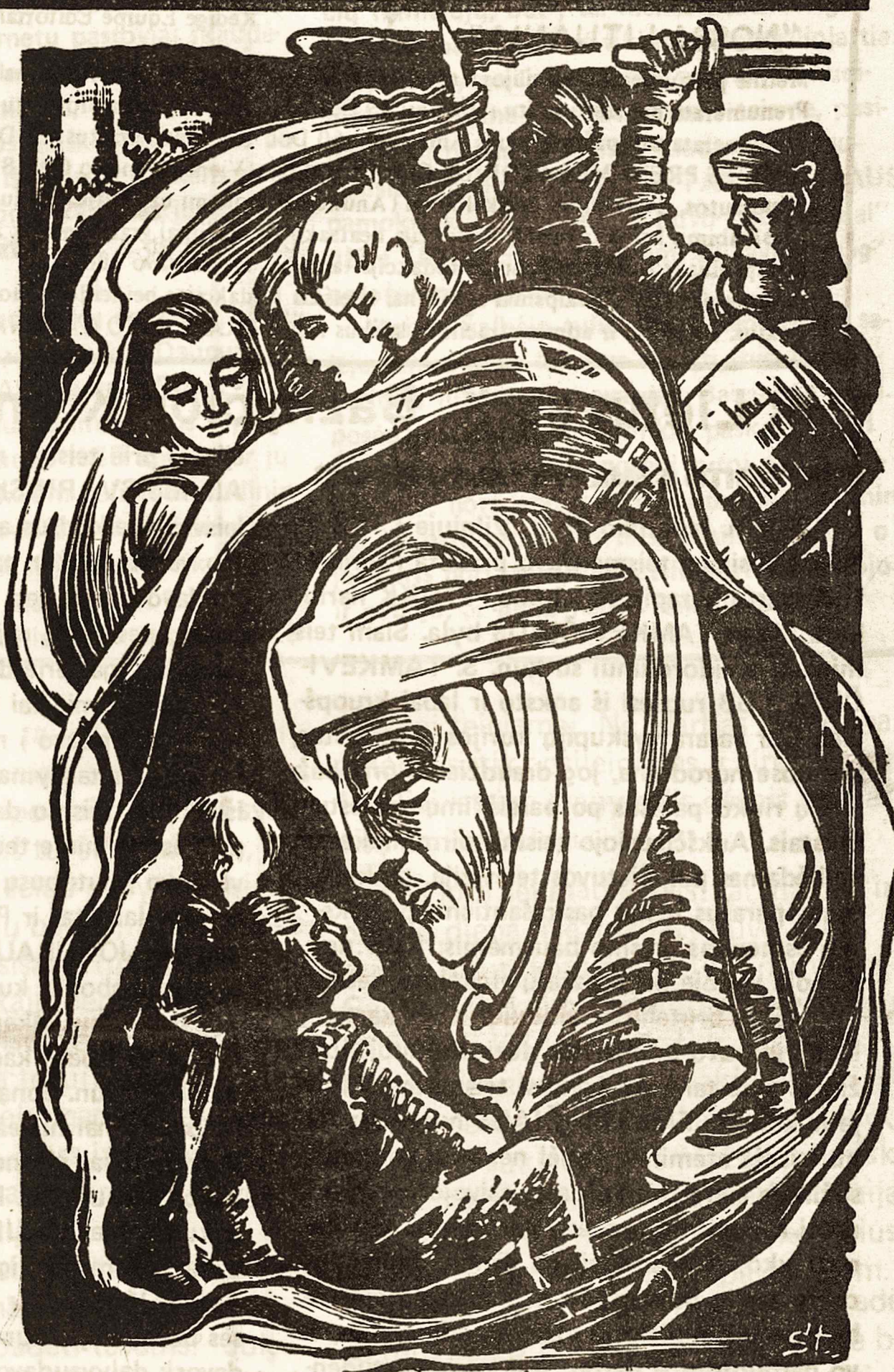
Dail. V. Stančikaitės iliustracija

Štai kodėl darome išimtį motinai, gerbdami ją specialia pagarba. Ir šioje motinai teikiamoje pagarboje ir meilėje teikiama pagarba gerai šeimai, kuri yra Bažnyčios, tautos, valstybės