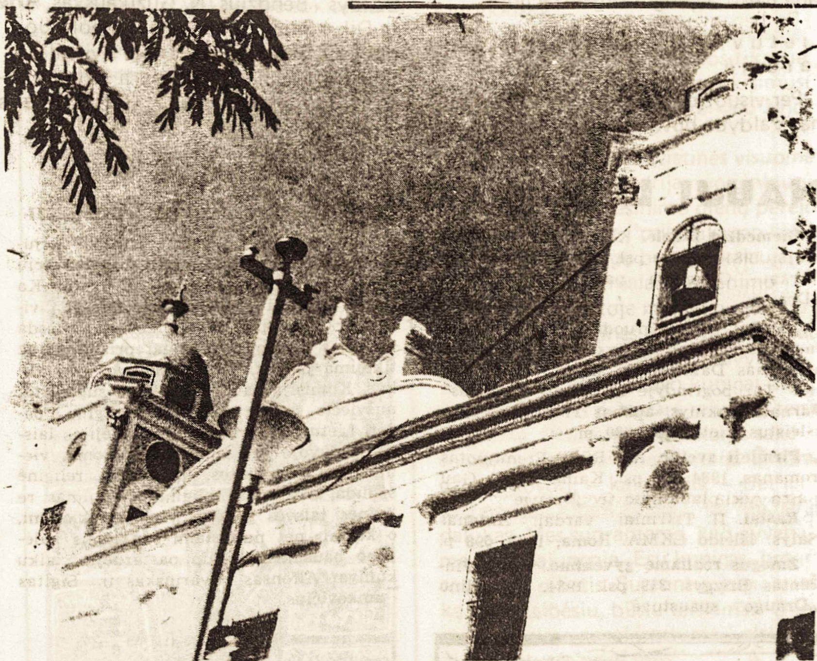
San Casimiro šventovė to paties vardo miestelyje Venezueloje. Araguvo provincijoje

Visi žinome, kad I-mas mėnesio šeštadienis yra skiriamas Švč. Panelei. Tą dieną mes visi lietuviai per visą pasaulį turime rinktis Rožančiaus maldai. Galime tikėti, kad mūsų vieninga malda per Rožančių pogrindžio spaudos keliu pasieks laisvės išsiilgusius tautiečius ir susijungsime kartu.