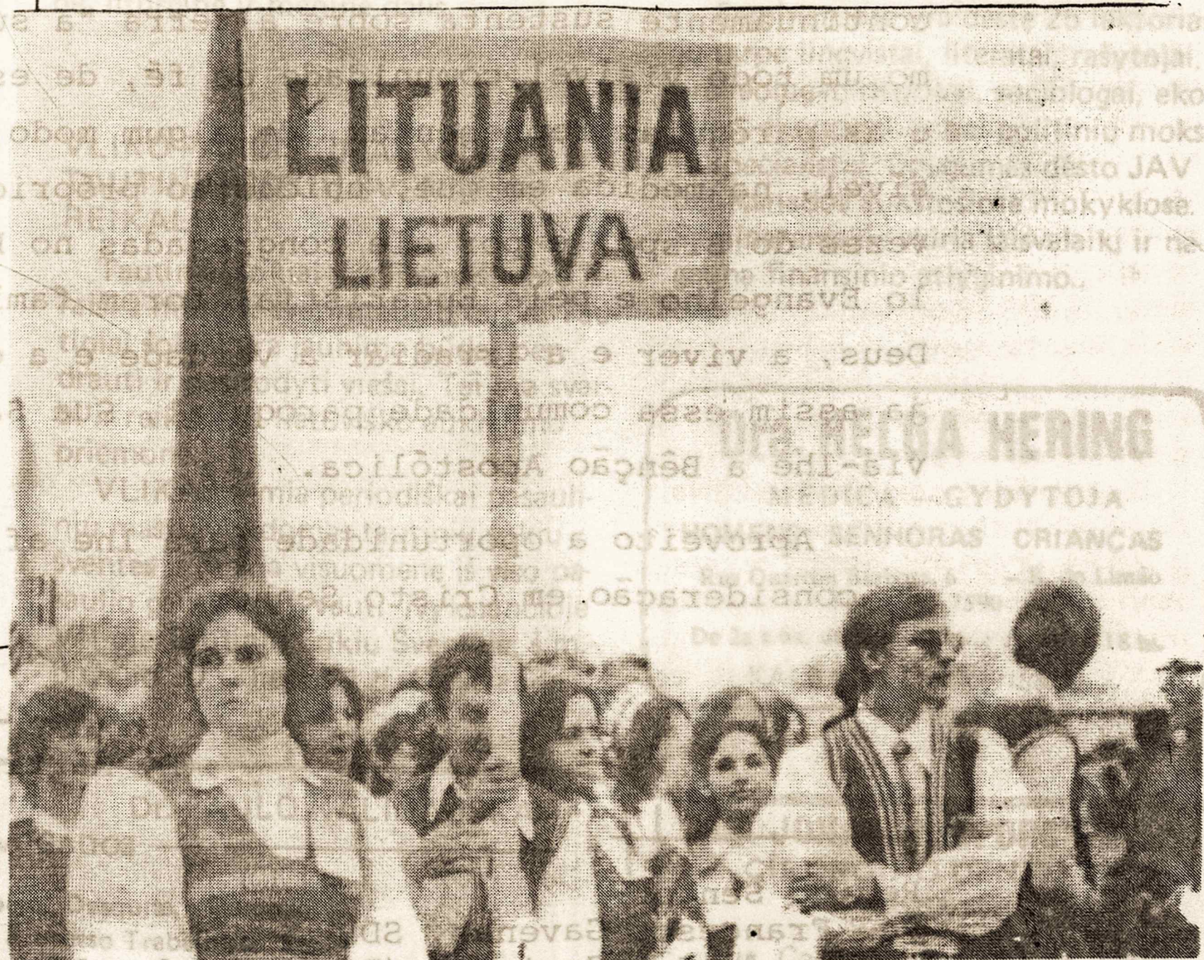
Brazilijos lietuvių jaunimas Popiežiaus lankymosi metu Sao Paule

Patį iškilmę bus apibūdinta plačiau sekančiam ML numerį.