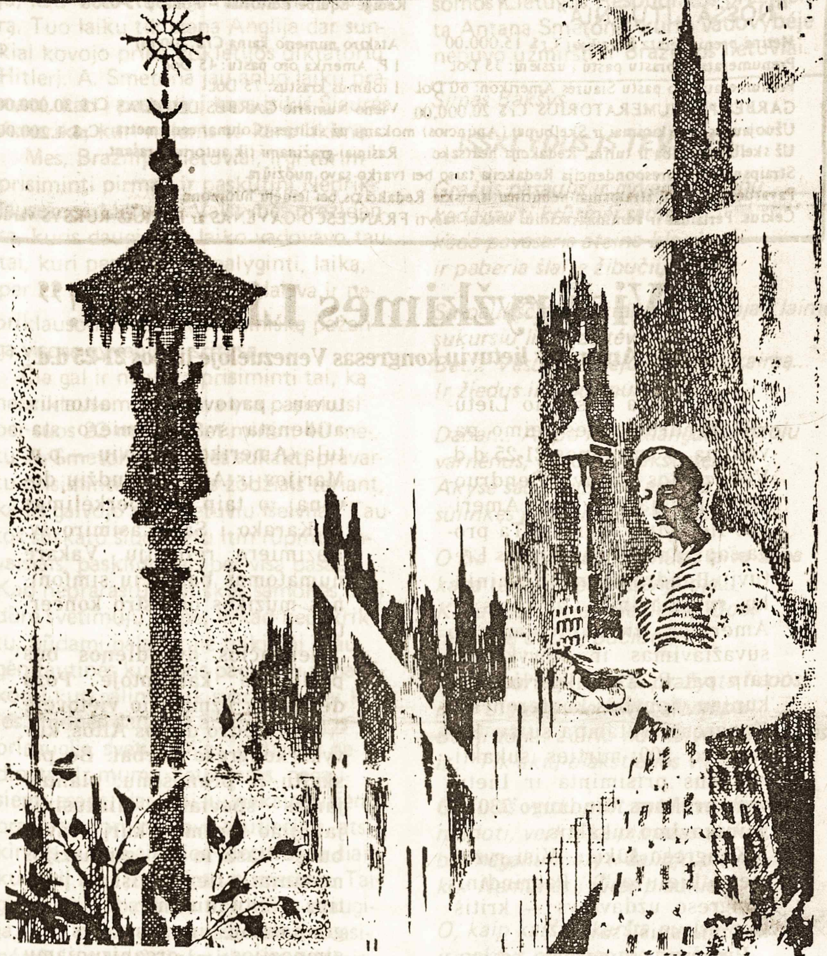
MŪSU MINTYS - KUR TĖVYNĖ MOTINA

Kad tai utopiška sistema paneigianti žmogiškumą ir tuo būdu tampanti didžiausia žmonijos problema, — aišku kiekvienam normaliam žmogui. Aišku ir sovietinio kalėjimo viršininkam, be to neleidžia pripažinti imperialistinis jų žmojis. Jie gerai žino, kad tai vergija, bet ji reikalinga "aukštesniems" dalykams, būtent, jėgos imperijai, planuojamai pasauliniu mastu. Dėl to jie savo sistemą stipriai gina ir dėl jos kovoja. Savo propagandoje jie tą vergiją vadina laisve, ir tai didesne nei Vakarų kraštuose. Pvz. visame pasaulyje gerai žinoma, kad sovietinėje sistemoje religija yra persekiojama, niekinama, naikinama. Tačiau sovietų valdžios (kalėjimo viršininkų) atstovai, net ir dvasininkai, dalyvaudami tarptautiniuose suvažiavimuose apie tai vengia užsiminti ir netgi kalba apie ten esančią religijos laisvę. Sovietiniai mokslo žmonės, atvykę į tarptautines konferencijas, taip pat vengia paliesti laisvės klausimą, ypač psichiatrai, kurių profesija sovietinėje sistemoje tapo pajungta žmonių kankinimui.