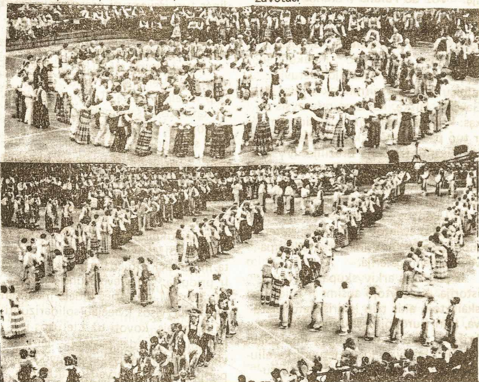
Šokėjai šoka MALŪNĄ VII Lietuvių Tautinių šokių šventėje Clevelande.

Šokiai dailūs, prirengti ponios Regi- nienės. Judesiai ir figūros išreiškiant staklės, malūno, arba blezdingėlės ju- desius sudarė gražų vaizdą ir kas pir- mą sykį matė tokį festivalį, stebėjo su- žavėtas.