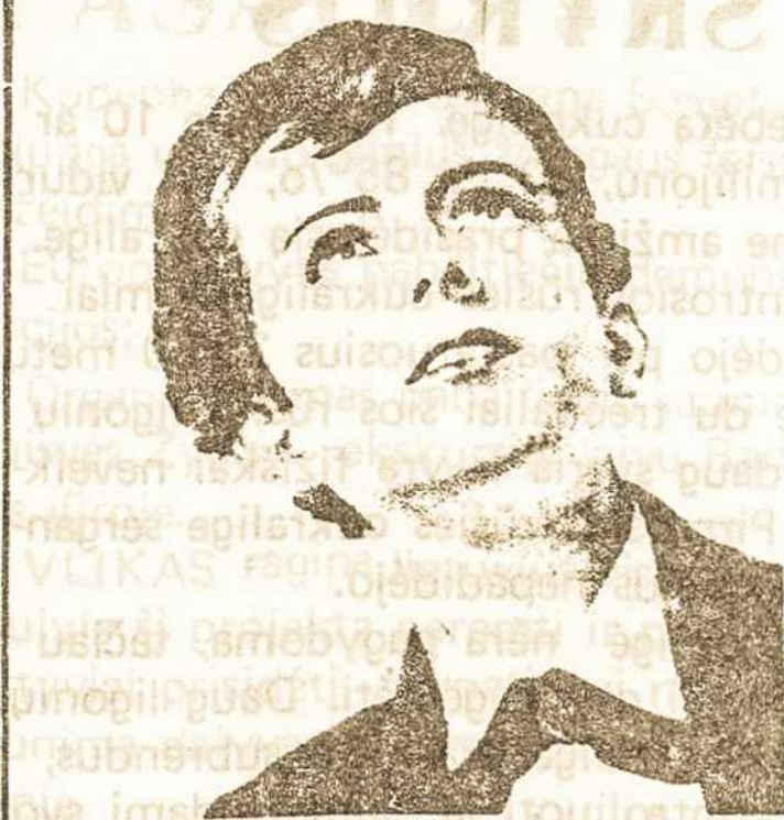
ŠV. DOMININKAS SAVIO

Beveik netikėtai, PPN gavo įvairių lietuvių dailininkų paveikslų, viršutinėje ir apatinėje salėje, dabar, gaunasi