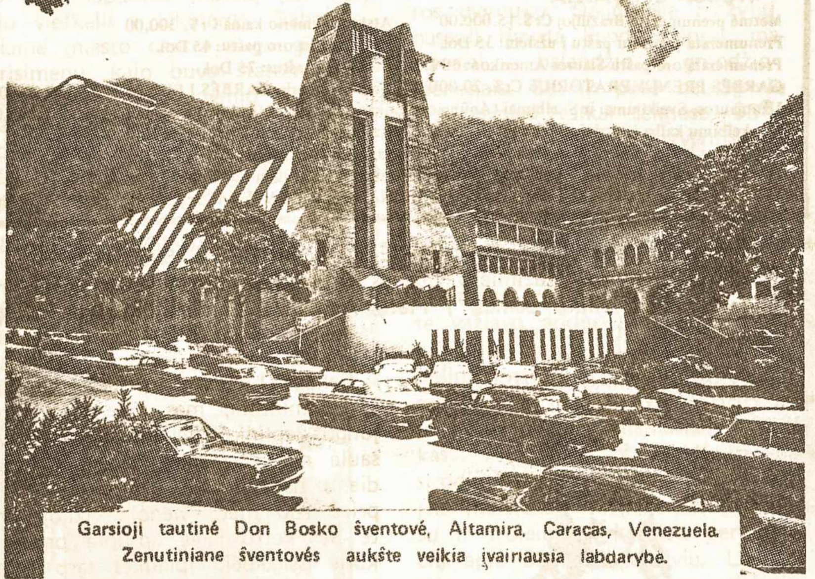
Garsioji tautinė Don Bosko šventovė, Altamira, Caracas, Venezuela. Zenutiniame šventovės aukšte veikia įvairiausia labdaryste.

II D. karo metu dauguma Europos tautų prarado laisvę. Laisvės vardan valstybės susivienijo ir