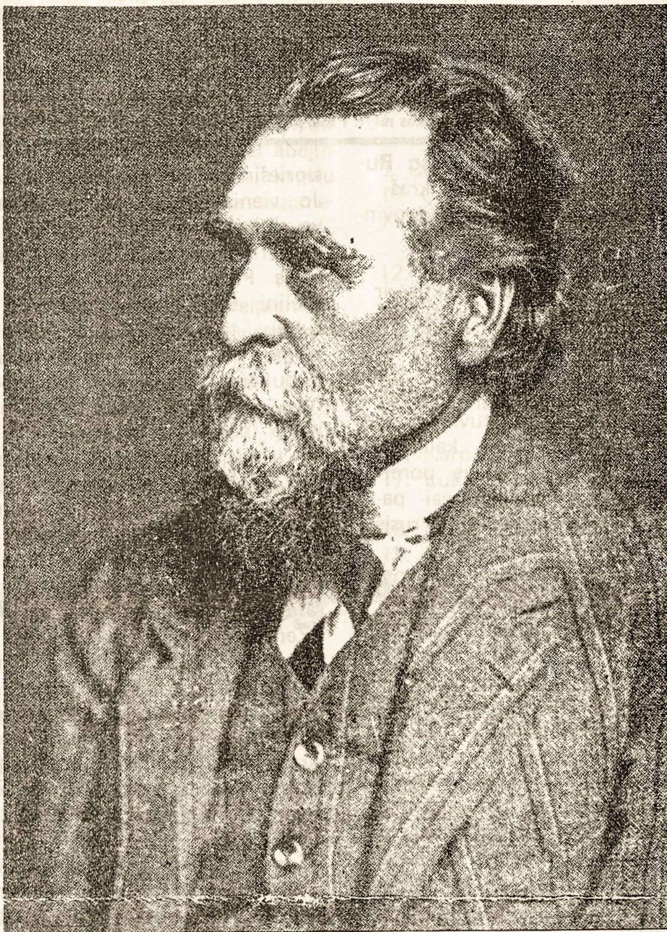
DR. JONAS BASANAVIČIUS

Lietuvių tautinio atgimimo patriarchas. "Aušros" įkūrėjas, rašytojas.