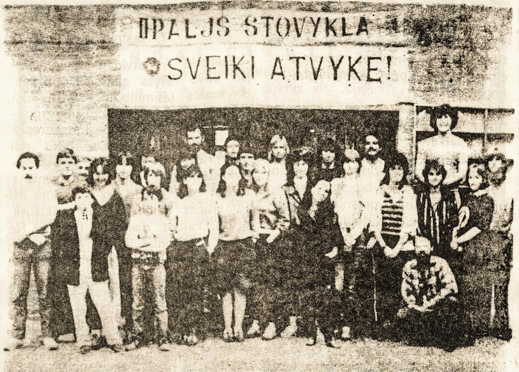
Antrojo Pietų Amerikos lietuvių jaunimo suvažiavimo stovykloje dalis jaunimo.