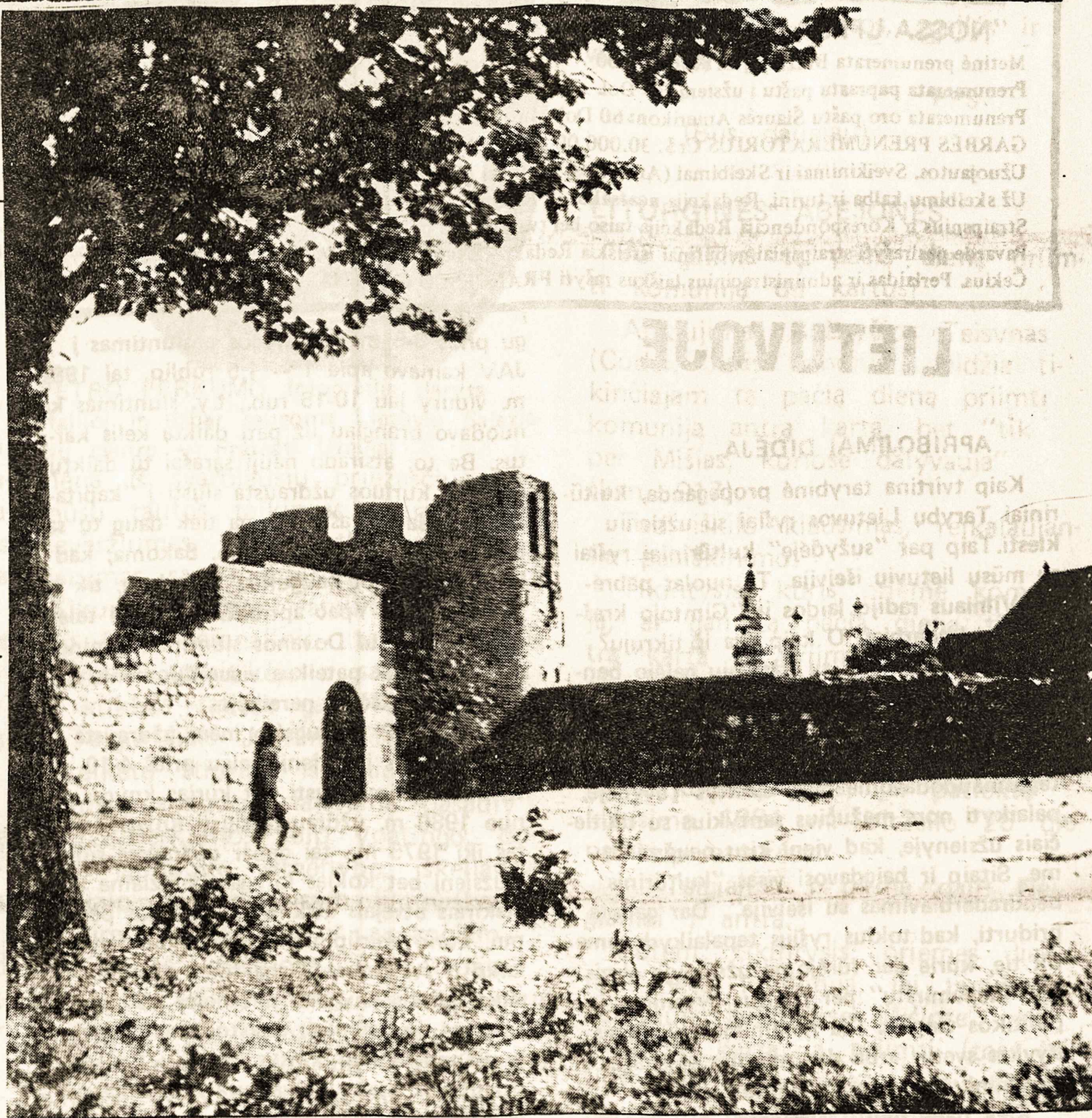
Kauno pilis ir dešinėje šv. Jurgio bažnyčia

Sovietų Sąjunga neskiria didelės reikšmės Amerikos susidomėjimu Lietuva ir ironiškai žiūri į jį. Ta- čiau Maskvos ironija vis silpnėja dėl nuolat augančio nepasitenkini- mo Lietuvoje dėl tautinių ir reli- ginių priešasčių. Nepasitenkinimas pamažu apima vis daugiau gyven- tojų ir tampa pavojinga grėsme. Vyriausybė padaro nuolaidų ir lei- do laisvai išpažinti tikėjimą, bet šie kompromisai yra tik žodiniai.