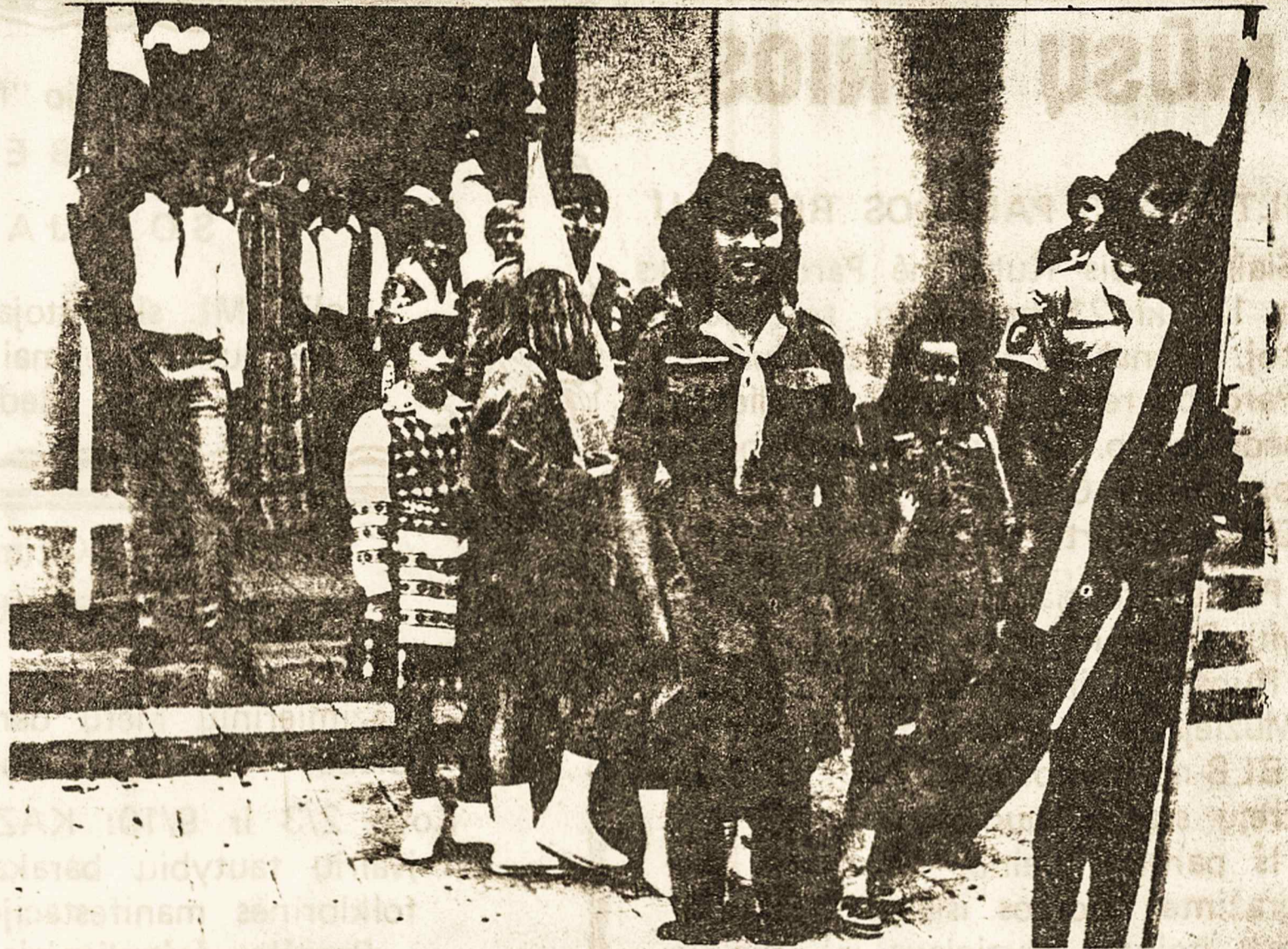
VASARIO ŠEŠIOLIKTOSIOS ŠVENTĖJE dalyvavo daug gražaus jaunimo uniformuoto ir pasipuošusio tautiniais rūbais.