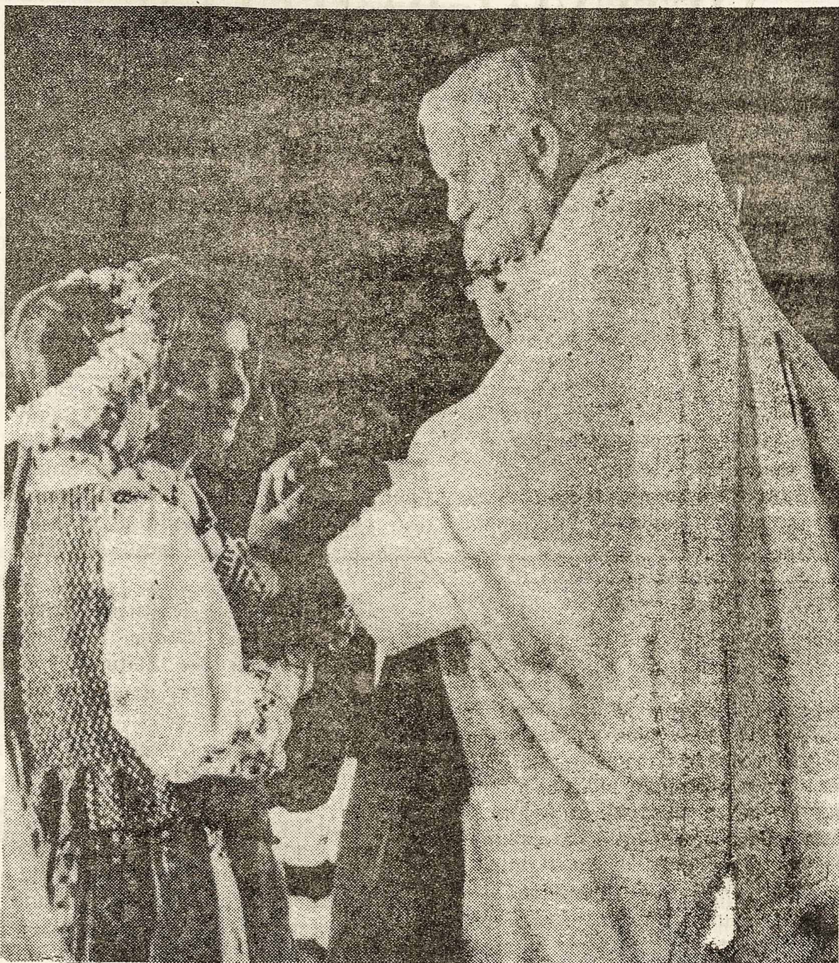
Jaunos Brazilijos lietuvaitės sveikina popiežių Joną-Paulių II Marakana stadijone

Taikos ateitis yra jūsų širdyse. Kad sukurtumėte istoriją tokią, kurią jūs galite ir privalote kurti, turite ją išgelbėti iš klaidingų kelių, kuriais ji dabar eina. Kad tai galėtumėte padaryti, turite būti tokiais žmonėmis, kurie pilnai pasitiki žmogumi ir giliai tiki jį žmogaus pašau-