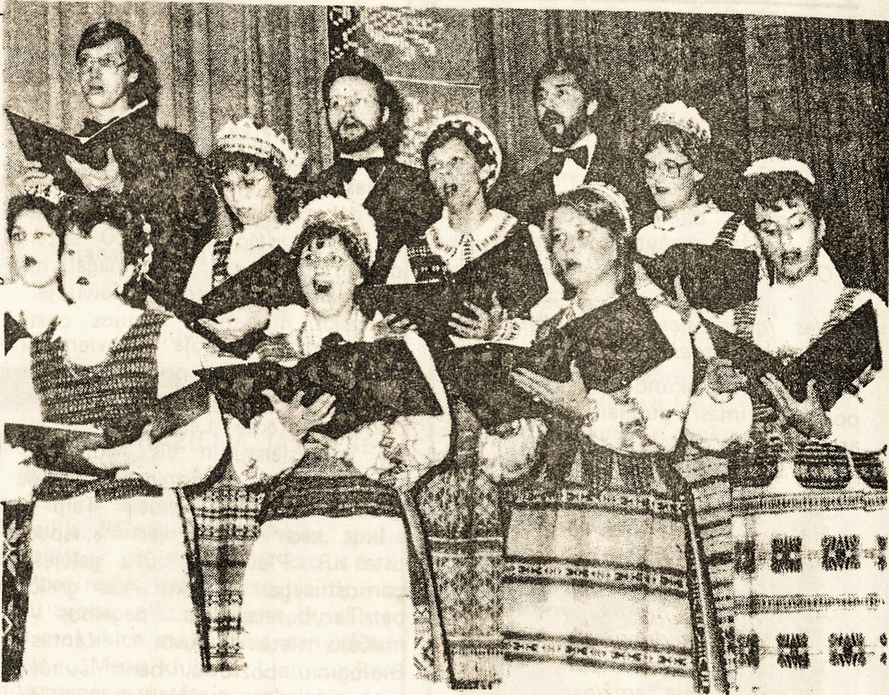
Dalis torontiškio "Volungės" choro. dažnai koncertuojančio įvairiose iškilmėse

Pradėjus susitikti su draugais, mūsų kalboje atsirasdavo daugiau anglišku žodžių. "Tik lietuviškai kalbėkite, tik lietuviškai". Tikriausiai visam gyvenimui išliks šie šventi mamos ir tėvelio žodžiai. Mūsų namuose skambėdavo lietuviška muzika ir daina,