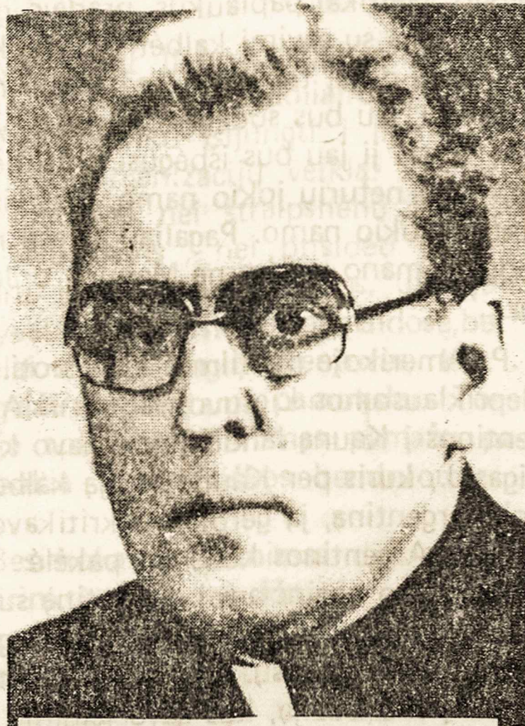
Kun. Alfonsas Svarinskas