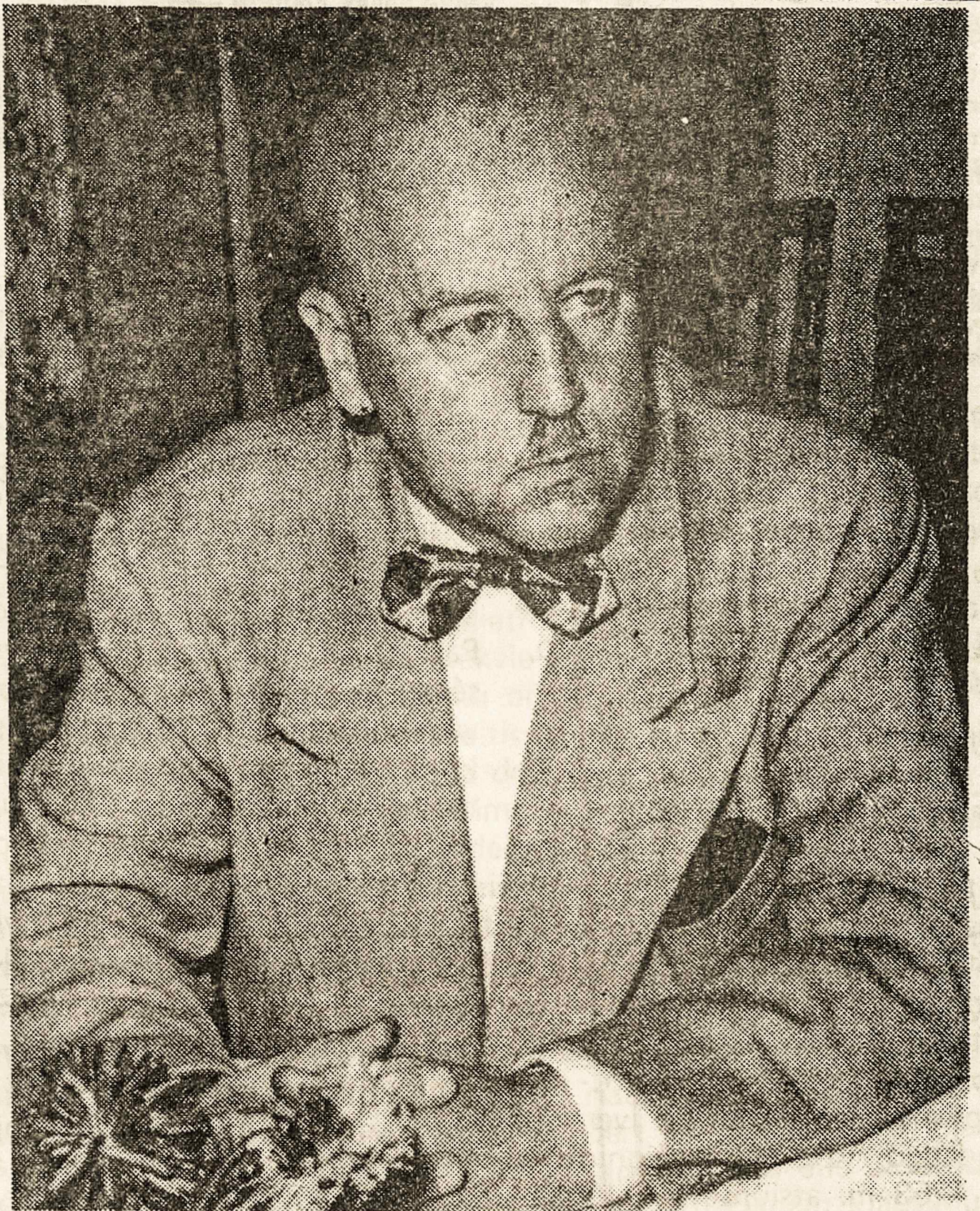
A.a. generolas STASYS RAŠTIKIS, buvęs nepriklausomos Lietuvos kariuomenės vadas, miręs Los Angeles mieste, JAV-se, š.m. gegužės 3 d.

Krikščionybės kelias į Lietuvą nebuvo lengvas. Mūsų protėviai gyveno toli nuo didžiųjų senovės kelių, todėl ilgą laiką mažai buvo žinomi. Pirmieji misisionieriai, bandę pasiekti baltų tautas, buvo čekų ir vokiečių vyskupai bei vienuoliai. 997 m. Prahos vysk. šv. Vaitiekus (Adalbertas) su dviem kunigais atvyko į Prūsų žemę ir bandė skleisti krikščionybę, bet buvo nesuprastas ir nužudytas. Toks pat likimas po 11 metų (1008) ištiko šv. vyskupą Brunoną (Bonifacą), mėginusį apaštalauti jotvin-