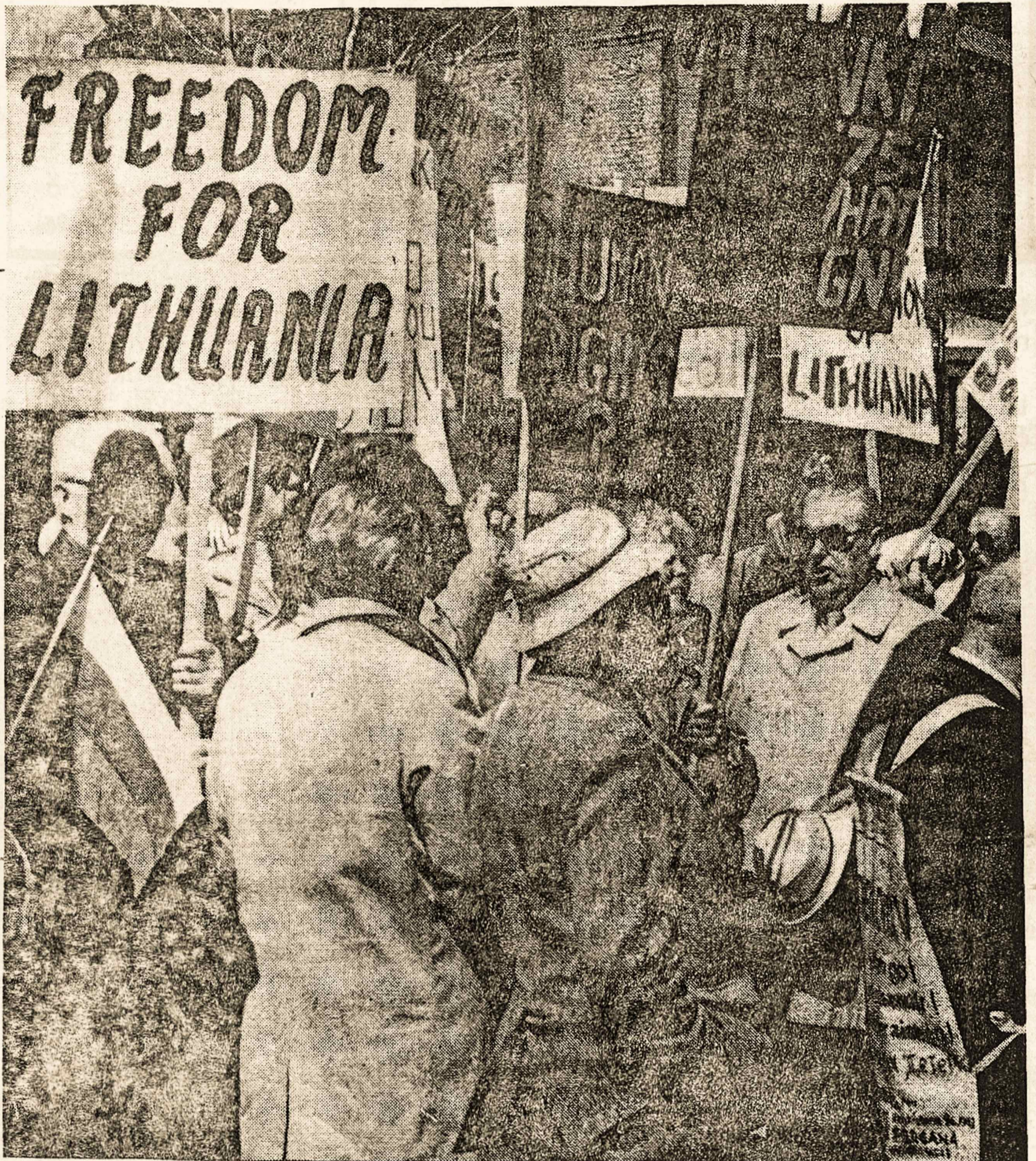
Lietuvių grupė baltiečių demonstracijoje š. m. gegužės 8 d. Kanados sostinėje Otavoje, kur vyko Helsinkio akto peržiūros konferencija. Baltiečiai protestavo prieš sovietinius žmogaus ir tautos teisių pažeidimus. Nuotr. St. Dabkaus Klišė T. Žiburių

Konferencijos metu prieš Kanados parlamento rūmus esančiam "Chateau Laurier" viešbutyje Kanados pavergtų tautų komitetas įrengė savo būstinę. Gan erdvioje salėje bus išstatytos kiekvienos pavergtos tautos parodėlės žmogaus teisių klausimu, dalinama informacinė medžiaga, koordinuojamos demonstracijos, kontaktuojami delegacijų nariai ir spaudos atstovai. Gegužės 8 d. būstinėje skirta Lietuvos klausimui kelti bei nušviesti dabartinei būklei Lietuvoje.