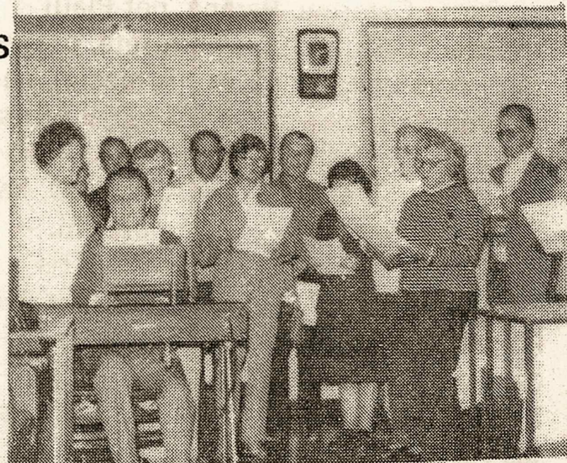
Šv. Kazimiero parapijoj Petrinių proga per mišias gieda chorelis vadovaujamas maestro Liudo Ralicko.