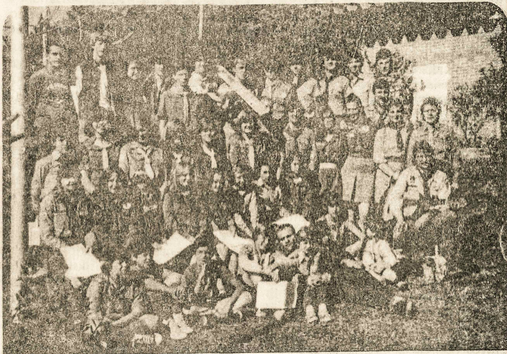
S. Paulo lietuvių skautų PALANGOS vietininkija gražiai stovykloje "DARIAUS ir GIRĖNO" stovykloje, Lituanikos sodyboje.

IŠEIVIJA tuo laiminga, kad ir ateitininkai, ir skautai gali laisvai veikti ir tęsti autentiškai lietuvišką tradiciją, į kurią jie šią vasarą pažvelgs jubiliejinėmis akimis. Skautai savo sukaktį paminės vasaros stovyklose, o ateitininkai – sukaktuviniu kongresu Čikagoje. Stabtelkime šiuo atveju ties pastaruoju, nes jis jau labai sparčiais žingsniais artėja ir skelbia žymiai stambesnę sukaktį. Dar nebuvo nepriklausomos Lietuvos, o ateitininkai jau veikė, ne tik veikė, bet ir kovojo už Lietuvos nepriklausomybės atstatymą. Tuometinis jaunimas degė lietuvišku idealizmu ir negailėjo savo jėgų tėvynei. Jis augo ir brendo carinės Rusijos okupacinėje sistemoje, tačiau nuo tradicinių pagrindų nenutolo. Kai atėjo lemiantis momentas, lietuviškame kaime išaugota tautinė žarija tapo plačiai besiskleidžiančia liepsna, kuri neužgėso ir Lietuvos nepriklausomybės laikais. Ateitininkija tuo būdu atliko istorinę misiją Lietuvos gyvenime – su svariu įnašu ji prisidėjo prie jos laisvės atgavimo ir vidaus gyvenimo formavimosi. Ji išsaugojo pagrindines mūsų tautos dvasines atramas – Dievą ir tėvynę bei prisidėjo