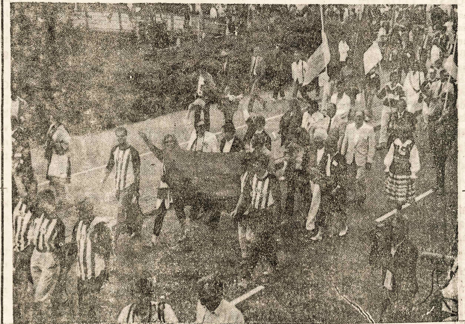
BALTŲ LAISVĖS ŽYGIS SKANDINAVIJOJ: pabaltiečiai žygiuoja Suomijos sostinės gatvėmis

tai gerojo tėvo, Šv. Kazimieras – didelio paklusnumo Dievo valiai ir širdies tyrumo. Marija atvaizduojama kaip skausmo pilna motina, stovinti po nukryžiuotuoju Kristumi, arba laikanti Savo mirusį Sūnų ant kelių.