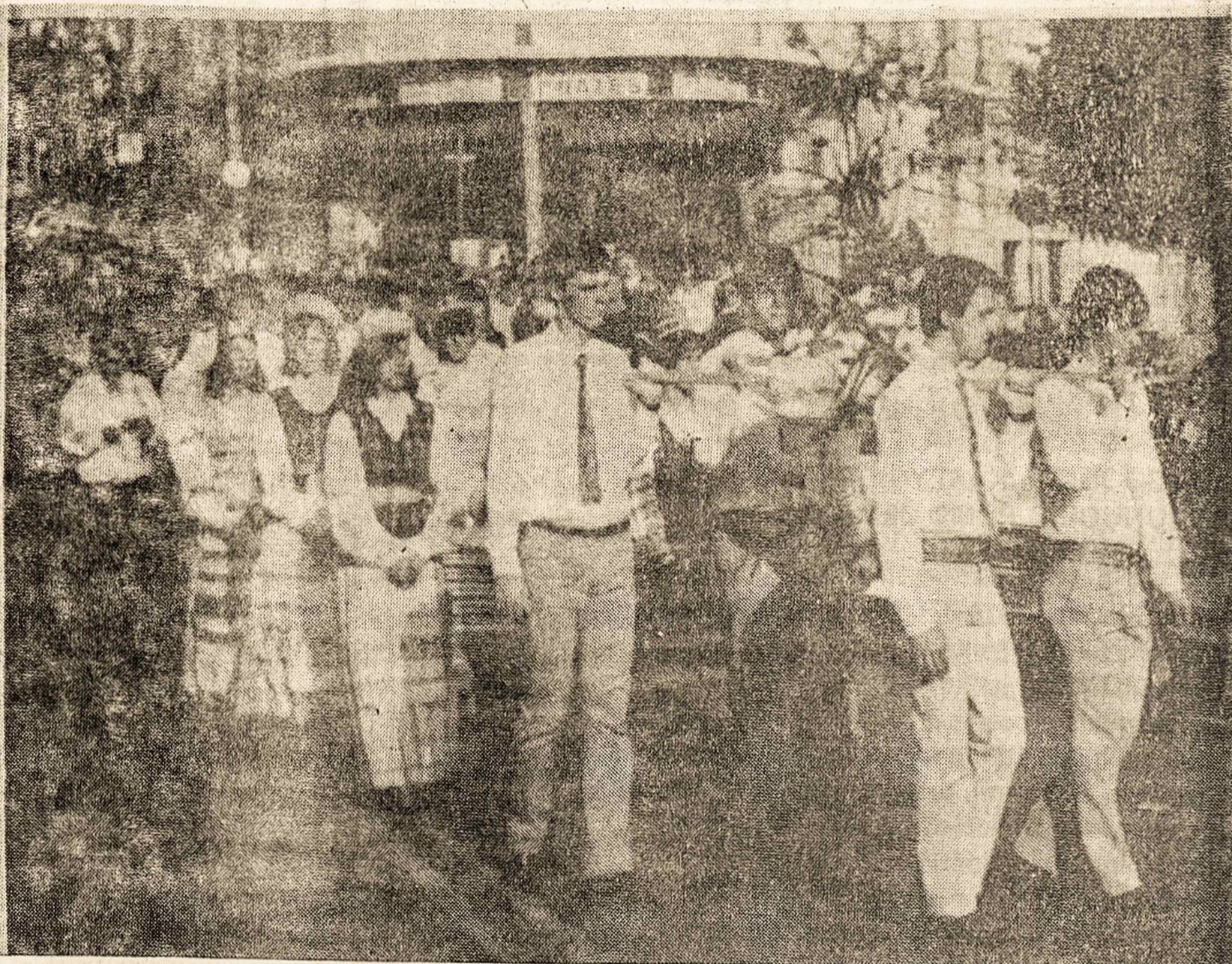
ŠILINĖS MOKOJ. Šventėje: procesijoje, mišiose ir minėjime dalyvavo daug žmonių, ypač jaunių. Nuotraukėje Volungės choristai neša Marijos statulą.

Tiesa, laukiam direktyvų, kurias duos Lietuvos Vyskupo sudarytas Jubilėjinis