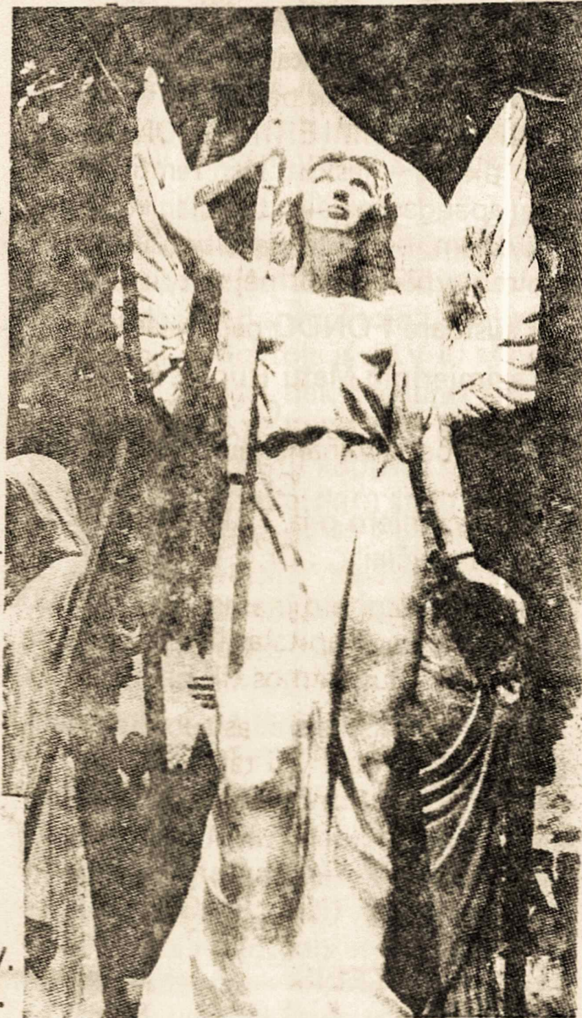
LIETUVIŲ IMIGRANTŲ PAMINKLO STATULA jau baigta ir įteikta į bronzės liejyklą. Skulptoriaus GILDO ZAMPOL atkurta gipsinė statula turi 1.70 m. aukštumą.

MŪSŲ LIETUVOS PRENUMERATĄ GALIMA UŽSIMOKĖTI TAIP PAT V. ZELINOS PARAPIJOS KLEBONIJOJ.