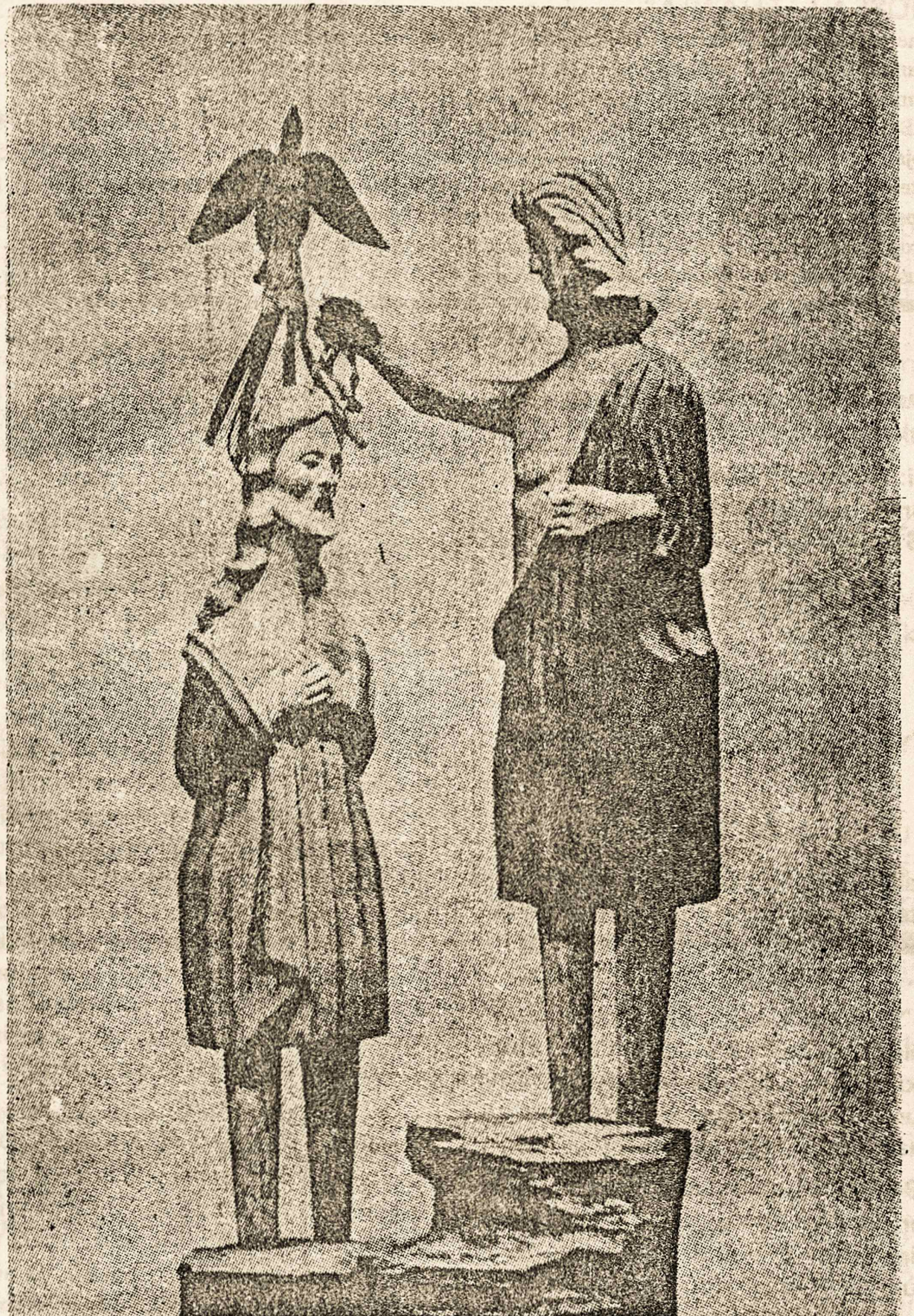
Šv. Jonas Krikštytojas, nežinomo lietuvių liaudies menininko darbas, saugojamas Kauno Valstybiniam Čiurlionio muziejuje. Vietovė nežinoma