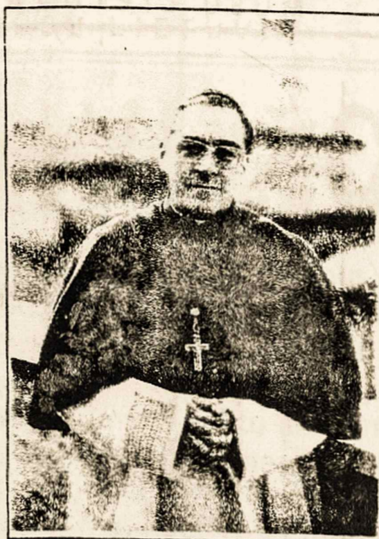
Lustiger: judeu e cardeal

suprato, nes tęsė: "ir Paryžiuo yra lietuvių bendruomenė, kuri puikiai veikia."