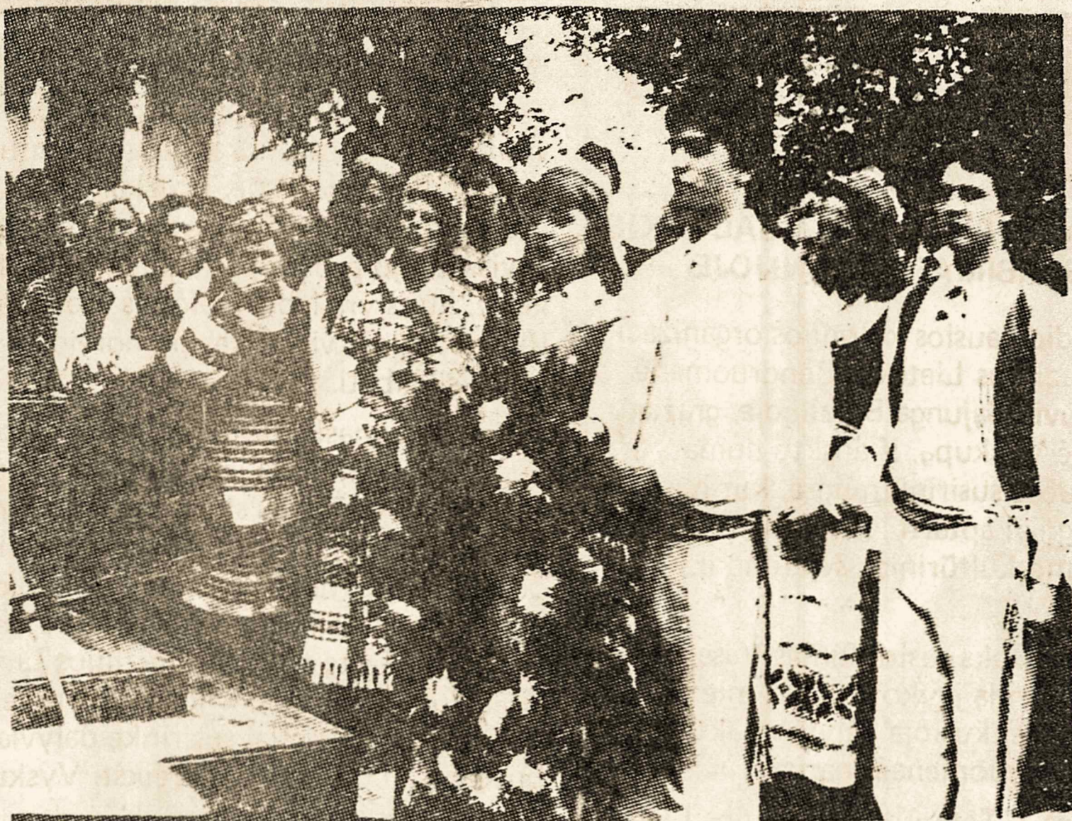
VILA ZELINA – VASARIO 16-SIOS ŠVENTĖ: prieš minėjimą, jaunimas padeda vainiką prie Lietuvos Laisvės paminklo pastatyto Lietuvos Respublikos aikštėje