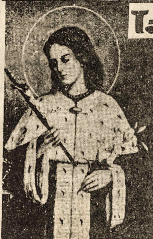
Šv. Kazimieras Lietuvos ir viso pasaulio lietuvių jaunimo globėjas