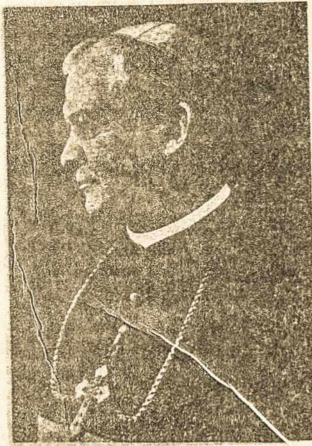
Dievo Tarnas ARKIVYSKUPAS JURGIS MATULAITIS - MATULEVIČIUS 1871 - 1927

1. Šventumo garsas. Tai ne paprasta propaganda, dirbtinai sukelta, o savaimingas, laisvas iš pačių tikinčiųjų kilęs sąjūdis. Jis pasireiškia kandidato į palaimintuosius kapo lankymu, puošimu, jo užtarimu malonių gavimu. Toks šven-