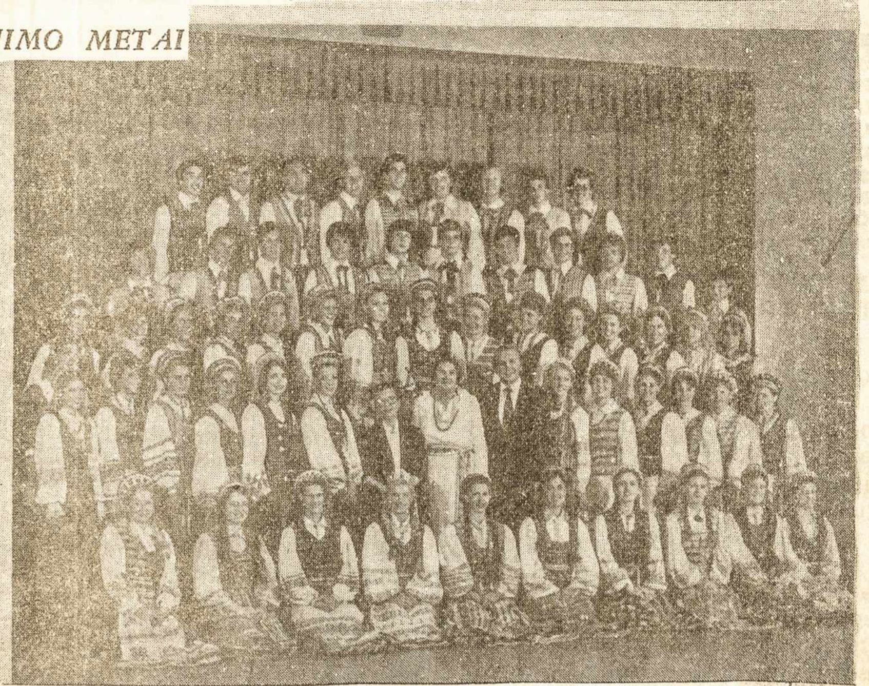
Los Angeles Lietuvių B-nės lietuviškų dainų ir šokių ansamblis "Spindulys", kuris šią savaitę vieši São Paule.

Čia šv. Kazimiero vardas (o su juo ir Lietuvos vardas) tikrai "išėjo iš mūsų tautos ribų", gan plačiai pasklido – ir dar vis plinta – plačioj brazilų visuomenėj. Ką įrodo ir balandžio 17 d. São Paulo Literatūros Akademijos auditorioj São Paulo Kultūrinio Centro iškilmingai įteiktas "Ciccillo medalis" vienam lietuviui. Už ką? "Už prasmingą įnašą į dailiojo meno skatinimą", kaip rašo "Centro Cultural" pirmininkas. O tas meno