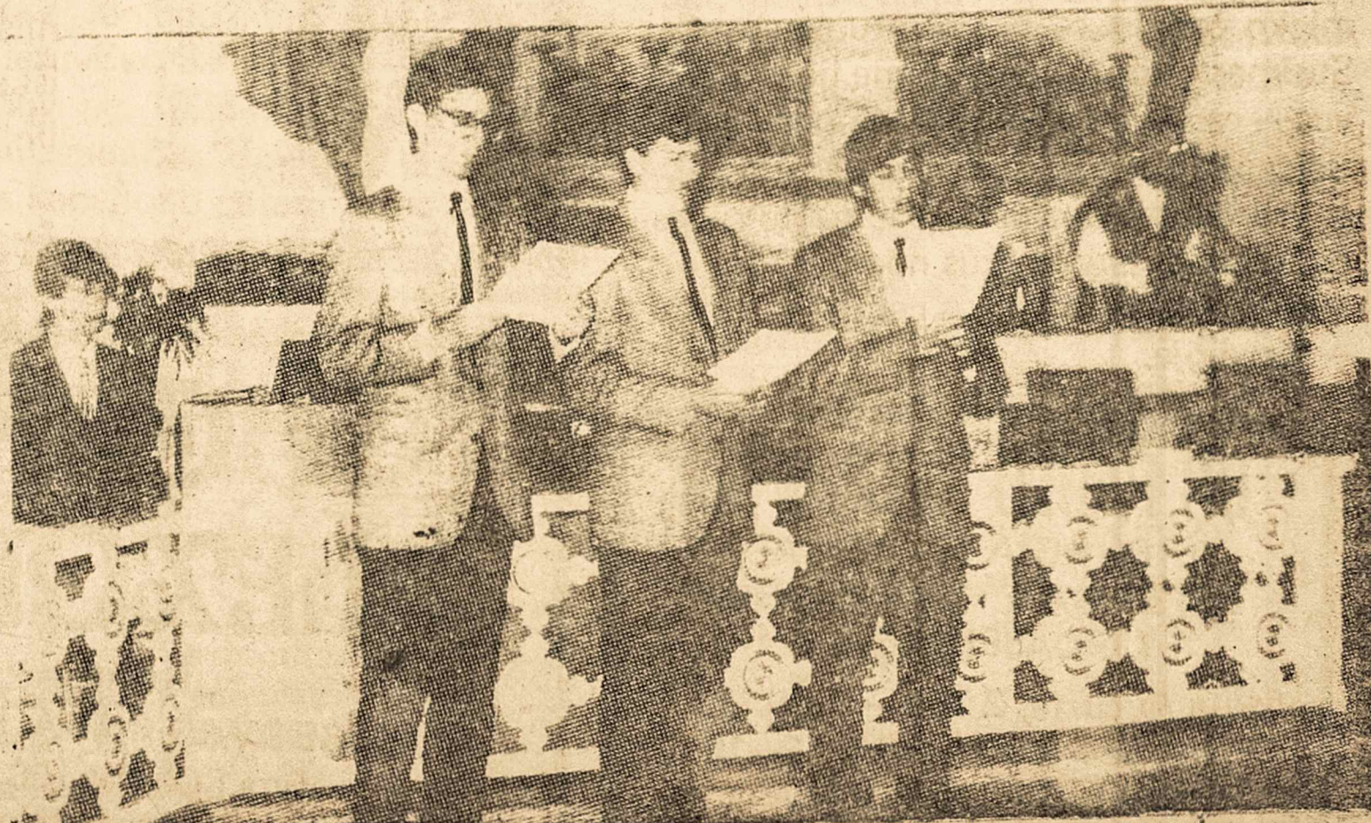
Spindulio trio per lietuvių Mišias V. Zelinose bažnyčioj