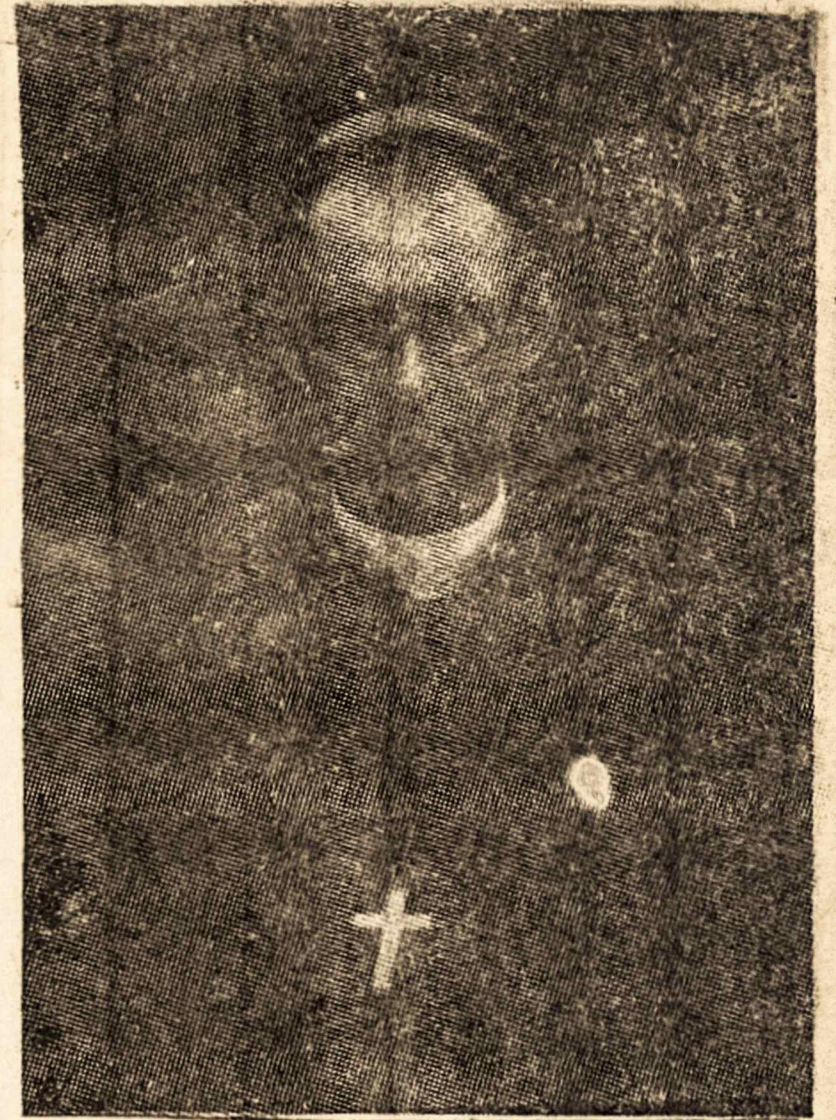
Arkivysk. Julijonas Steponavičius, "Lietuvos krikščionių tvirtovė".

Tik kartą per 25-rius tremties metus vyskupas Steponavičius galėjo sugrįžti į Vilnių. Jo vyskupystės 25-ųjų metinių proga valdžia jam leido Vilniaus Šv. Mykolo šventovėje atnašauti pontifikalines Mišias, nes Vilniaus katedra jau seniai