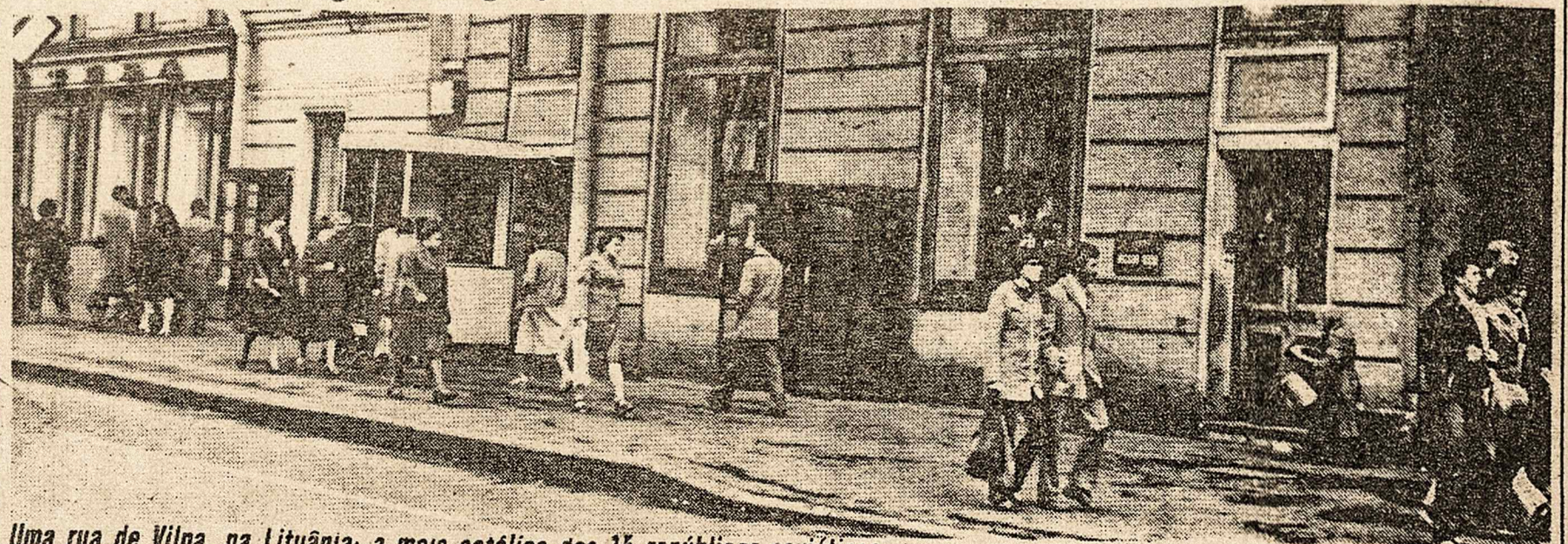
Uma rua de Vilna, na Lituânia: a mais católica das 15 repúblicas soviéticas.