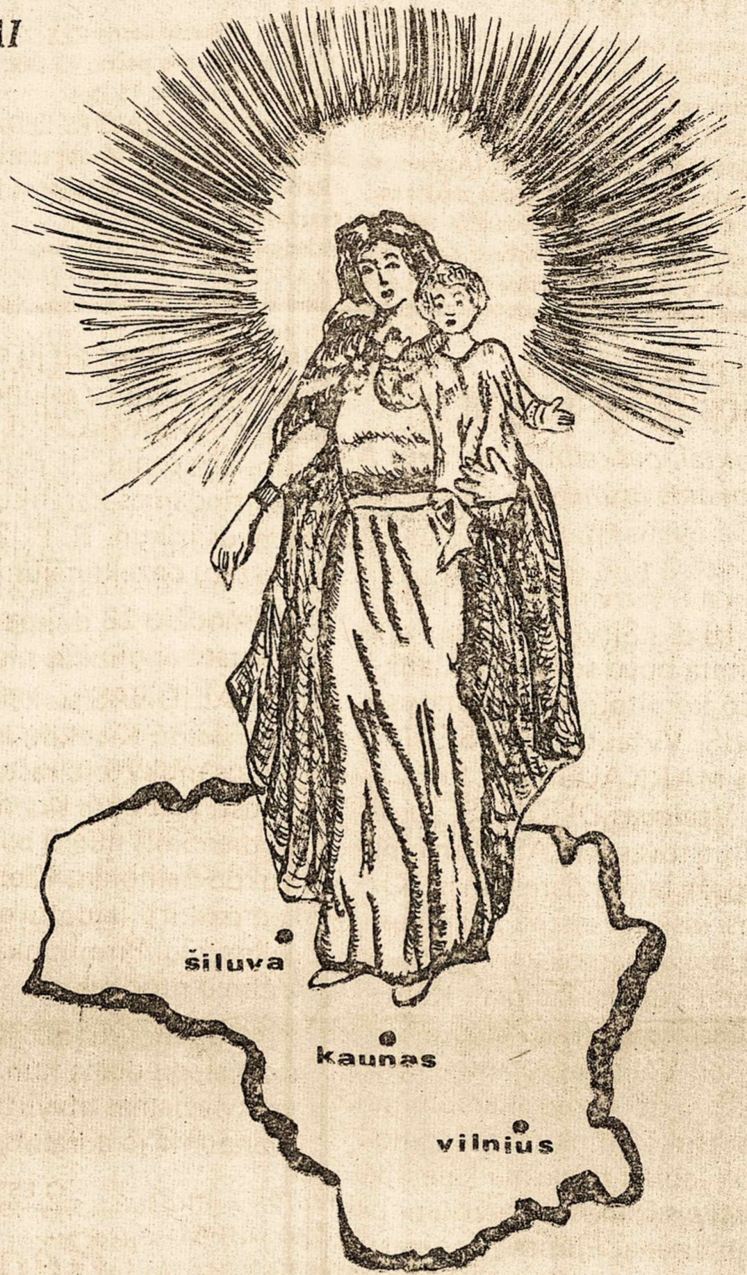
"Čia mano žemė", pirštu rodė Švč. Mergelė Marija, atsistojusi ant akmens Žemaitijos šile

Marijos apsireiškimas, pirmas žino- mas Europoj, įvyko 1608 Šiluvoj. Mari- ja pasirodė piemenėliams ganykloj, ant dideio akmens – jauna, gražiai pasipuo- šusi, palaidais plaukais, su kūdikiu ant rankos, verkianti ir tyli. Vaikų pašaukti atvyko iš Šiluvos kalvinų seminarijos