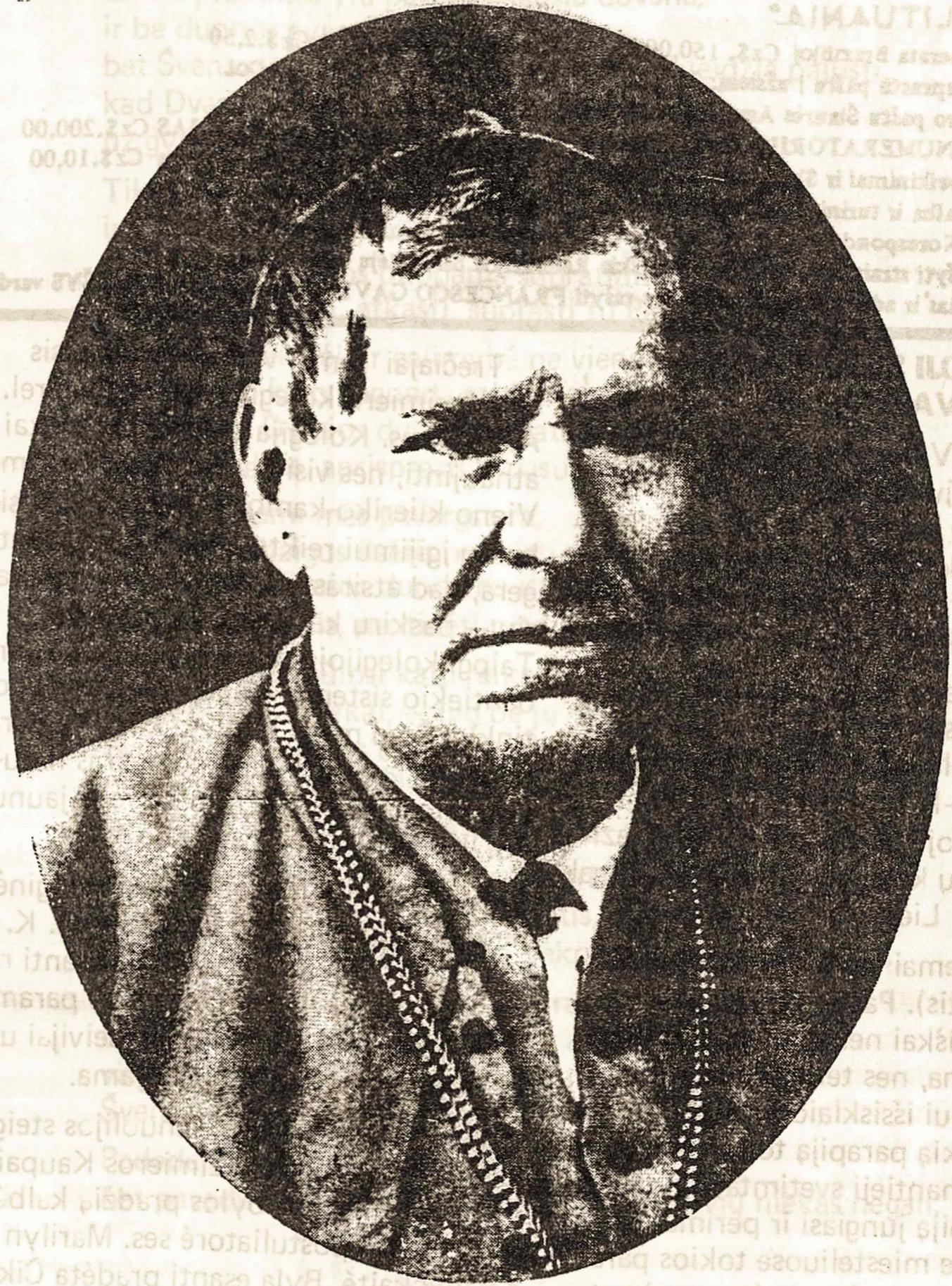
Uysk. MOTIEJUS VALANČIUS 1801 – 1875

Lietuvių kalba yra rimtam pavojui ir dabar – kai Lietuvos vaikai turi kalbėti, dainuoti ir net galvoti rusiškai pačiam vaikų daržey. Tačiau susipratusių tautiečių yra ugdoma ir puoselėjama – ne tik gyvu žodžiu, o ir raštu, kiek tatau galima.