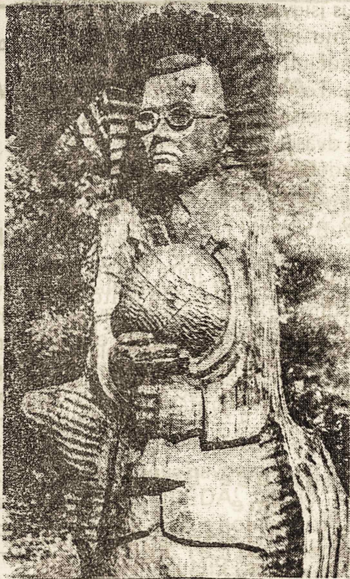
Mato Šalčio medžio skulptūra tėviškėje.

Matas Šalčius, žymus Lietuvos rašytojas ir keliautojas. Jisai domėjosi kelionėmis, troško matyti ir jausti kaip žmonės gyvena kituose kraštuose, apie ką galvoja, ko siekia ir parodyti jų gyvenimo būdą. To paties tikslo vedamas, Matas Šalčius aplankė Braziliją, svečiavosi Argentinoje, dirbo prie DULRo leidžiamo laikraščio "Išvien", nukeliavo Urugvajun ir pasiekė Boliviją, kur šio neramaus žmogaus kelionė nutrūko. Matą Šalčių priglaudė amžinai Guajaramirim miestelio kapai, o jo gimtinės Čiudiškių kaimo gyventojai, prisimindami savo sūnų, prieš daugelį metų iškeliavusį į pasaulį ir daugiau nebesugrįžusį į tėviškės laukus, pastatė jo medinę skulptūrą su gaubliu rankoje, su išdrožtais žodžiais: "Būki laiminga, Lietuvos žemė, amžiais žydėki ir kilki".