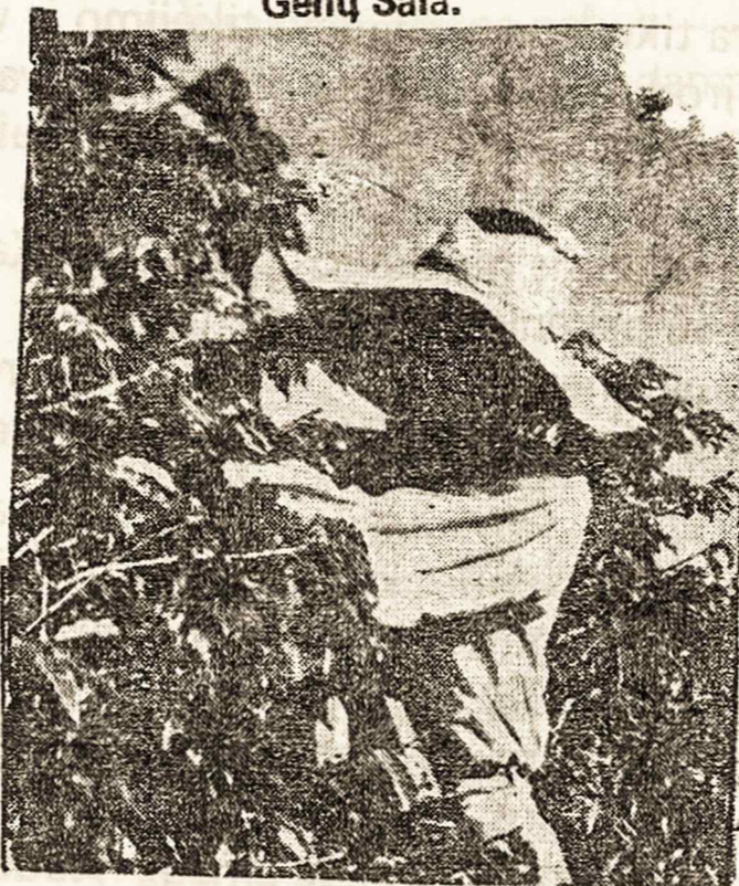
Jau laikas rąškyti kava