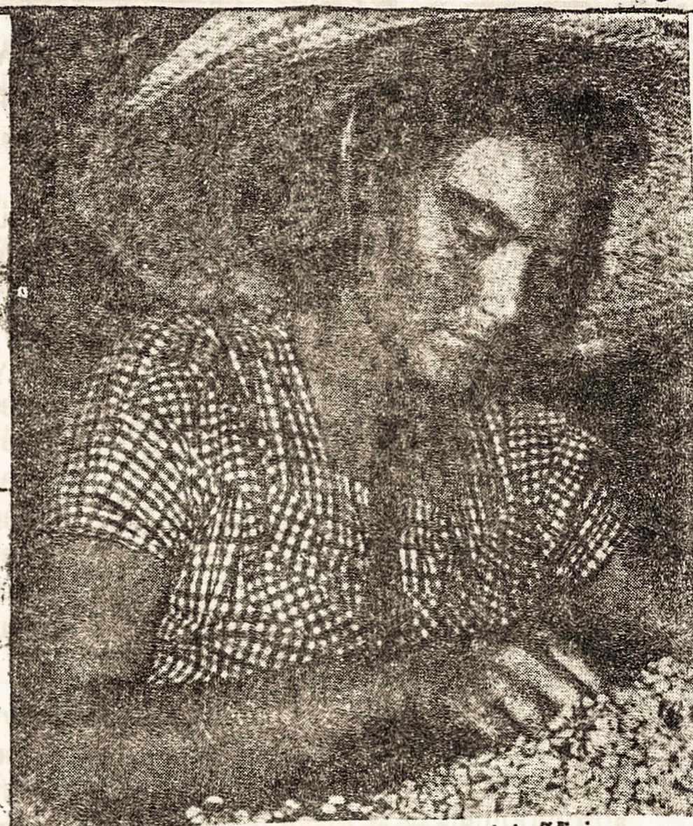
Atrenkam pirmajai rūšiai.

Pereitame šimtmetį prasidėjus ir vis didėjančiam imigrantų plūdumui į Braziliją, Ilha das Flores saloje buvo pastatyti Imigracijos Rūmai — imigrantų priėmimo ir patikrinimo punktas. Čia sutalpinama būdavo apie du tūkstančiai naujų ateivių. Pravažiuojantiems laikiniems gyventojams valdžia įtaisė reikalingiausius žmogaus gyvenimui patogumus, būtiniausius sveikatos apžiūrai įrengimus ir religiniams aptarnavimams įtaisus. Liuoslaikiui praleisti ir studijų bei žaidimų aikštės ir salės taip pat sudarė bendros paskirties Imigracijos Rūmų kompleksą. Išbuvę nustatytą laiką ir po atliktų visų formalumų, emigrantai išskirstomi į fazendas, kur, pagal pasirašytą sutartį, (nors tų sukakčių niekuomet jie neskaitė), kur privalėjo išdirbti du metus, ir tik po to gauna laisvę ir teisę aplikti dvarą.