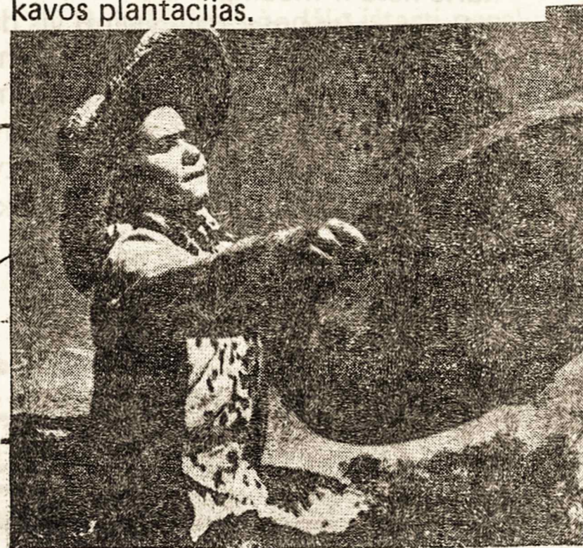
Reikia gerai išvėtyti.

Pirmas imigranto kontaktas su naująja tėvyne — jos žmonėmis, žeme, gamta ir vietos papročiais, — buvo Ilha das Flores (Gėlių Sala). Tai stebėtinai graži, Guanabaros įlankoj, gamtos apdovanota atogrąžų sala, arti Rio de Janeiro miesto, kuris taip pat vadinamas "nuostabiuoju". O Guanabara, vietos indionų tarme, vadinasi "Jūros krūtis". Vykstantieji su darbo sutartimis įvairių pasaulio kraštų emigrantai būdavo išlaipindami ir saloje apgyvendinami kelioms dienoms, kol Imigracijos departamento valdininkai sutvarkydavo jų paskirstymą į fazendas — milijonines kavos plantacijas.