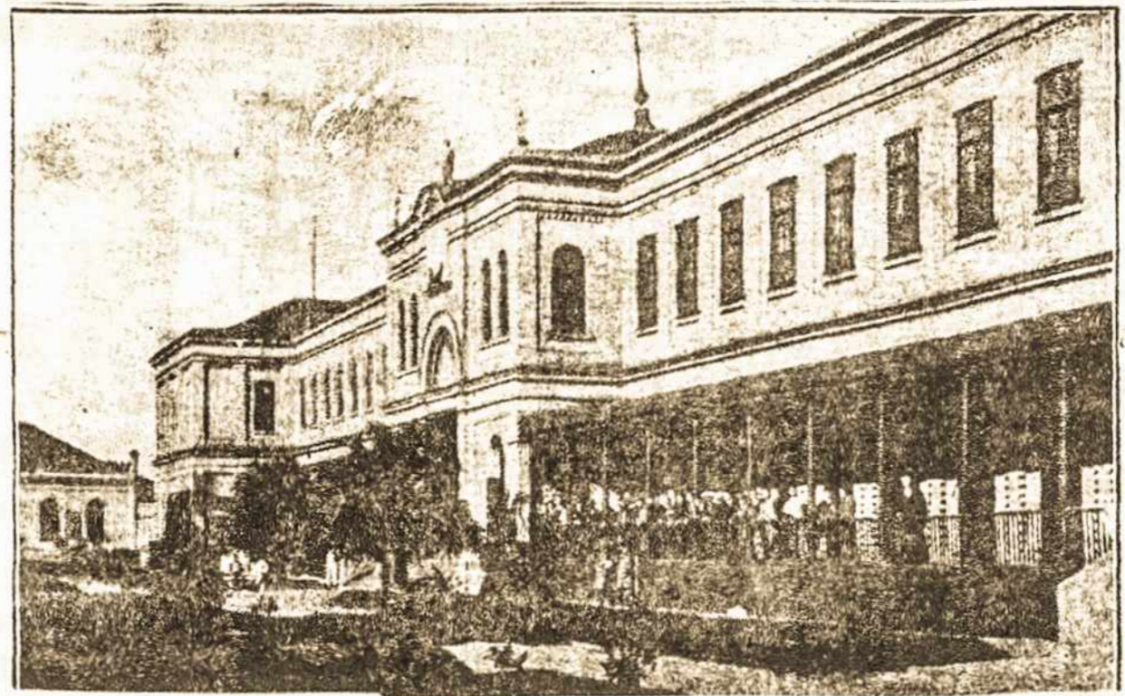
HOSPEDARIA DE IMIGRANTES

Nedarba ir visoki nedatekli kęsdami mūsų tautiečiai, šaukėsi pas pažįstamus, klausdami apie darbą, prašydami kur ir kaip rasti išeitį iš šios gyvenimo dramos. Taip ir mūsų čia paminėtas "laimės ieš-