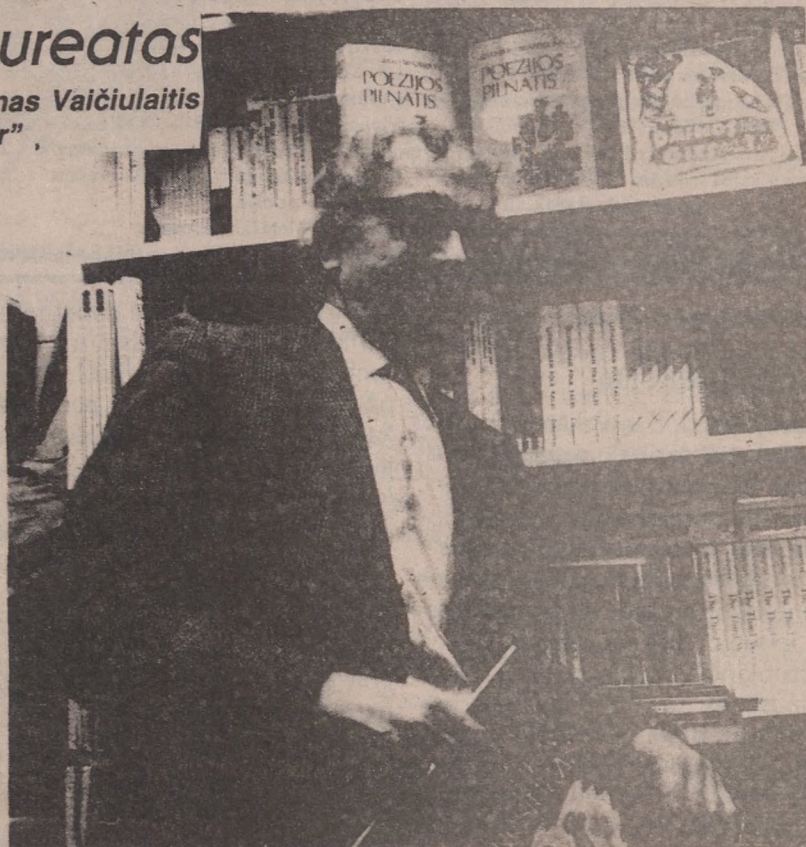
Poetas BERNARDAS BRAZDŽIONIS, pagerbtas JAV Lietuvių Bendruomenės kultūros tarybos literatūrine premija