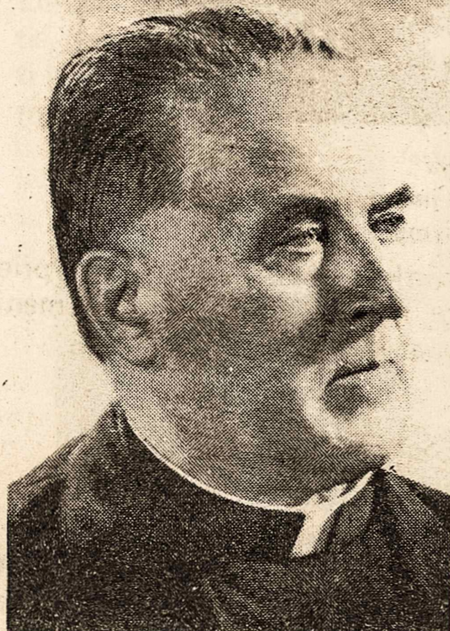
Atvelyky, balandžio 26

Jubiliejinės programos metu šv. Kazimiero parapijoje ypatingas prisiminimas