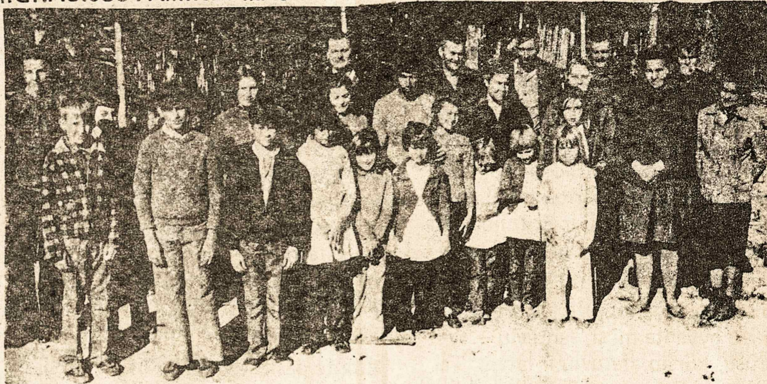
Barão de Antonina kolonijos lietuviai, susirinkę šventiškai praleisti laiką ir aptarti priaugančios kartos ateitį.

Pradėjus "Aušros" draugijai telkti apie save ateivius ir skelbti užsibrėžtą darbų planą, susilaukė didelio žmonių susidomėjimo. "Aušros" priešakin buvo statomi žmonės, kurie tikrai geidė išjudinti lietuvius ateivius iš beviltiško nusiminimo ir savyje užsidariusio snaudulio. Sukrutę organizuotis ir įsitraukti į visuomeninį darbą, stojo dirbti Aušron ir sta-