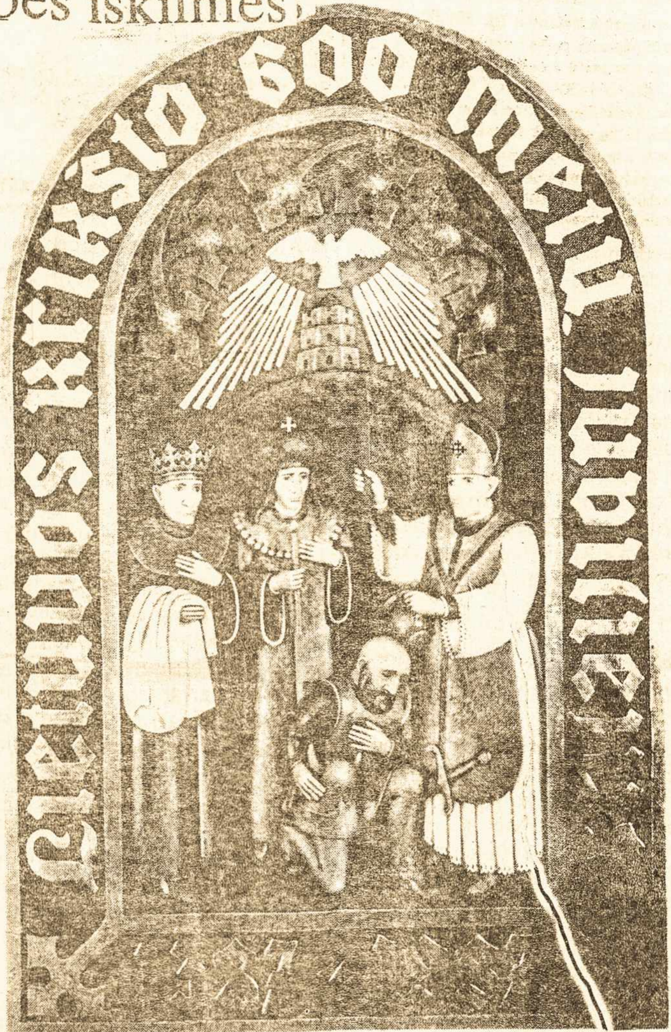
Medžio drožinys-bareljefas, vaizduojantis Lietuvos krikštą prieš 600 metų. Jis laikomas Telšių katedroje.