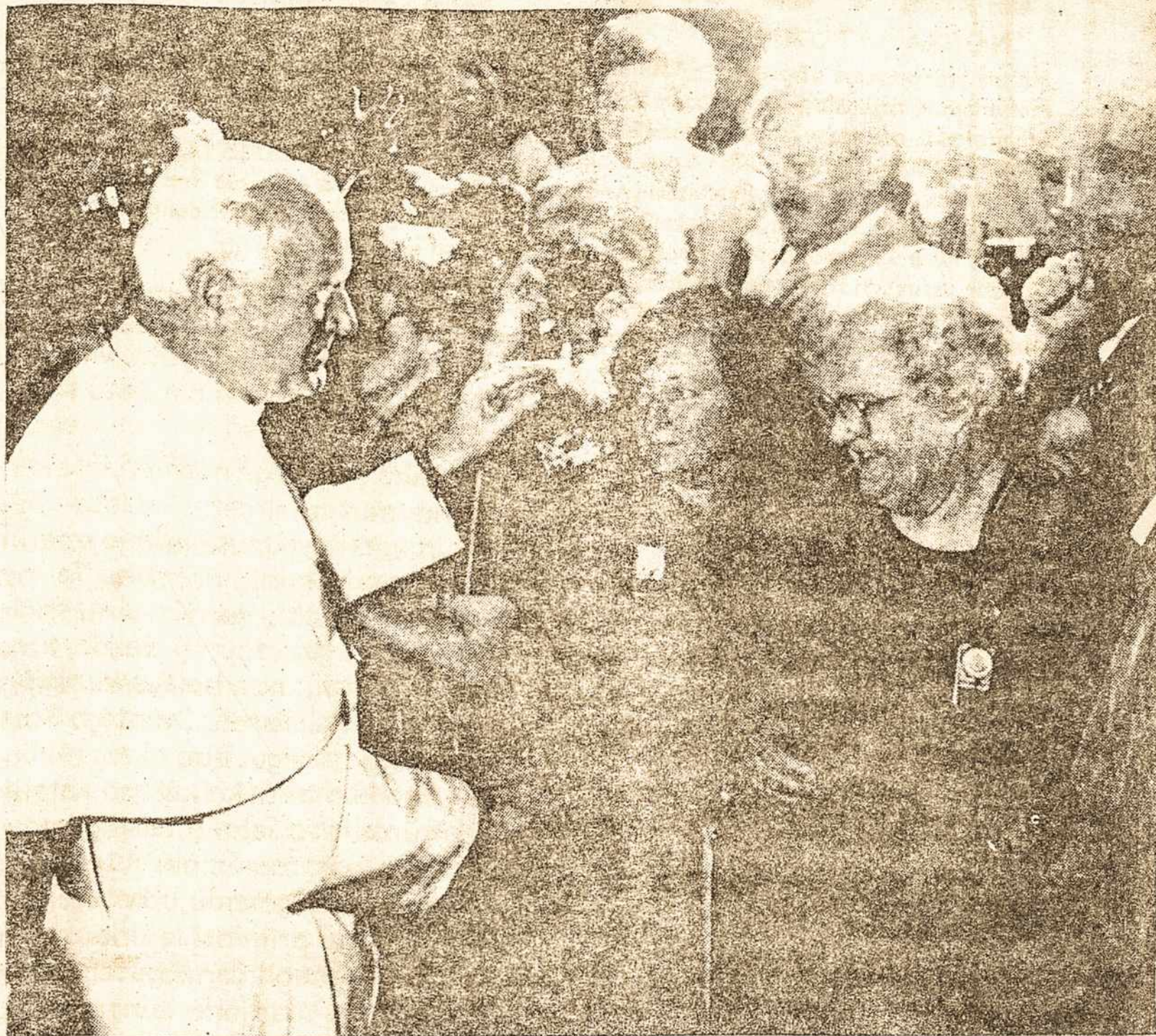
Šv. Tėvas JONAS-PAULIUS II sveikina su lietuviais maldininkais audiencijų salėje 1987 m. birželio 27 d. per Lietuvos 600 Metų Krikščionybės jubiliejaus ir arkivyskupo Jurgio Matulaičio beatifikacijos iškilmes.

3. Šių iškilmių liturgija veda mus į vidinį žmogų, kuris yra iš naujo atkuria-