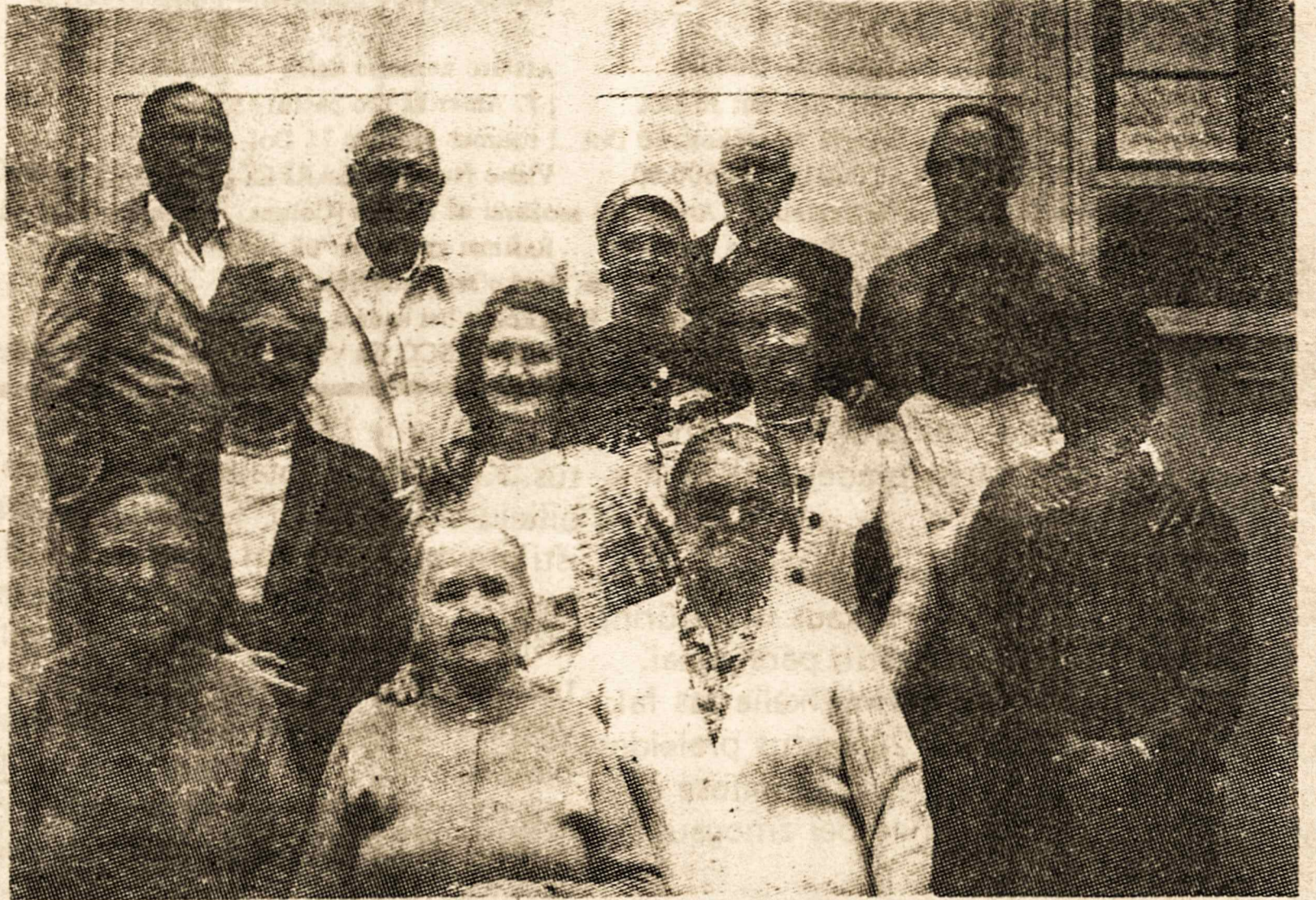
Dalis Parque das Nações (Sto. André) lietuvių dalyvavusių pamaldose Lietuvos 600 metų Krikščionybės paminėjime tame rajone.

Po demonstracijos sovietai užblokavo telefoninius ryšius su užsieniu. Iš V. Europos su vilniečiais demonstracijos dieną nebuvo įmanoma susisiekti. Tylėjo ir Maskvos telefonų centrinė. Telefo-