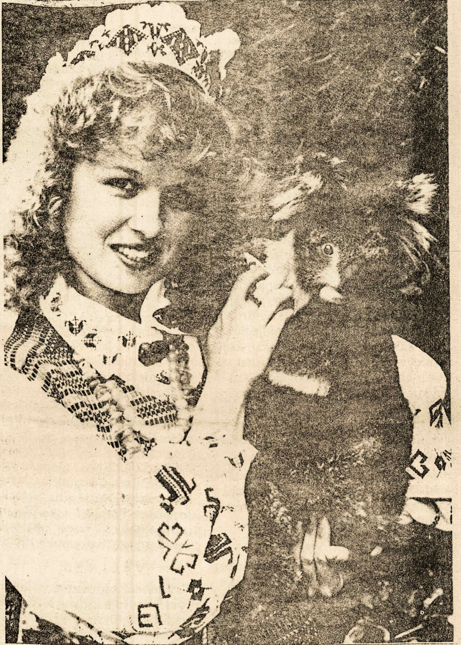
Australijos lietuviai ir lietuvaitės laukia atstovų ir svečių į PASAULIO LIETUVIŲ JAUNIMO VI KONGRESĄ.