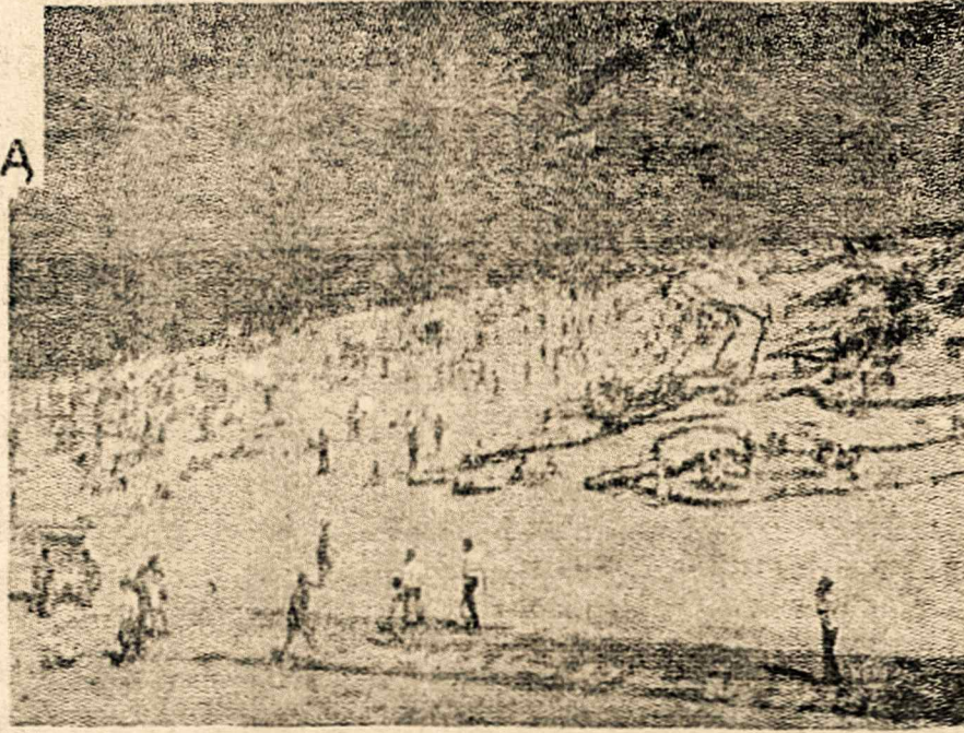
PALANGA vasaros atostogų metu naliai suplanuotu restoranu.

Pagalčiau jvažiuojame į Klaipėdą ir sustojame prie viešbučio "Klaipėda". Viešbutis naujas, moderniškias su origi-