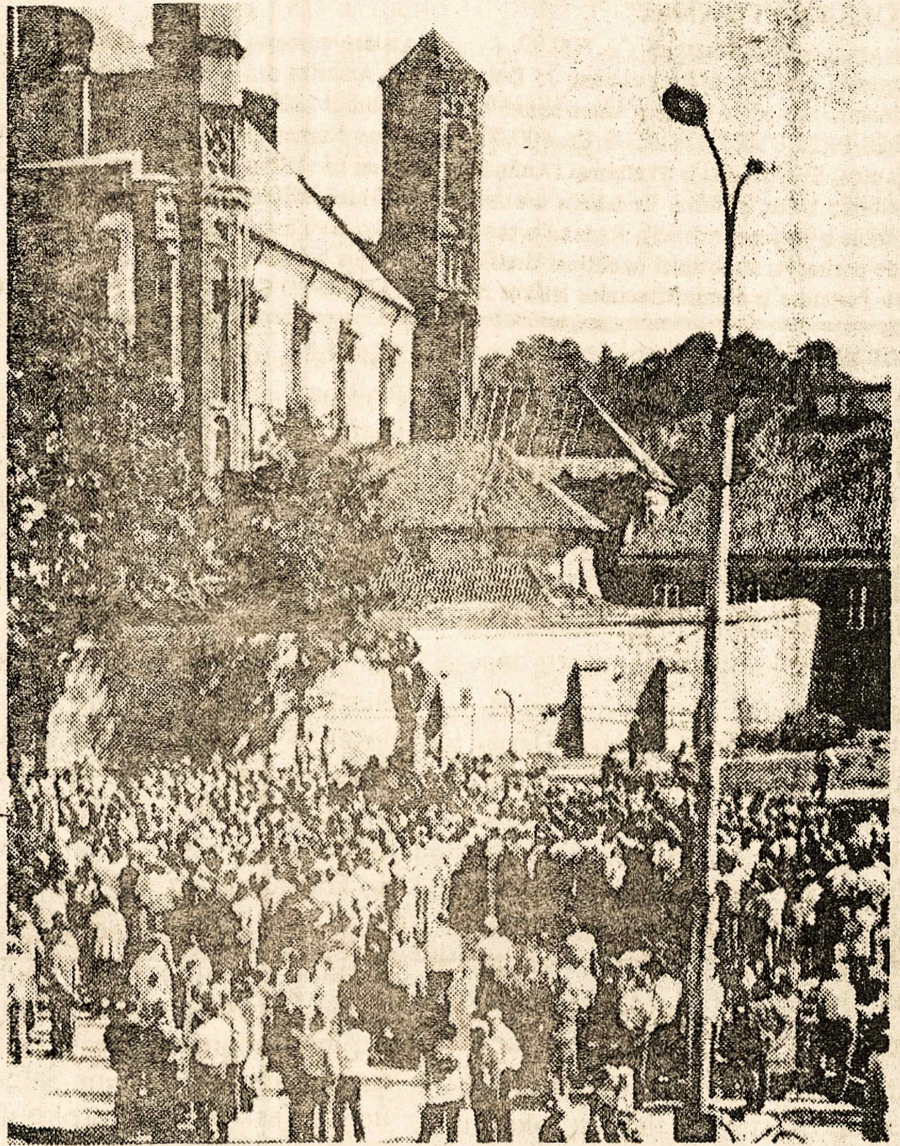
Ištrauka iš buvusių praėjusių sekmadienį, rugpjūčio 23 d., demonstracijų netoli Bernardinų ir Šv. Onos bažnyčių, aikštėje prie poeto Adomo Mickevičiaus paminklo Vilniuje.