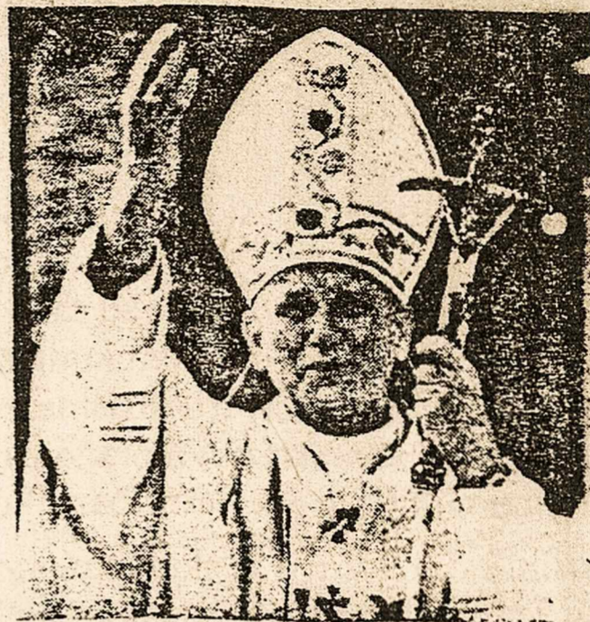
Popiežius Jonas Paulius II

Tiesa neišlašina alyvos į žaizdas, kad sustabdytų skaudėjimą, nei ji pasodina tave ant vedamo gatvėmis asilo; tiesa turi būti skausminga, ir ji turi slėptis. Projektai gimsta smegenyse. Žmoguje pastatytas trobesys pasviręs; mes norime ištaisyti ne jo langų skliautinius lankus, bet jo pagrindą, besipriešinanti giliai apačioje tai, kaip bangos priešinasi laivui.