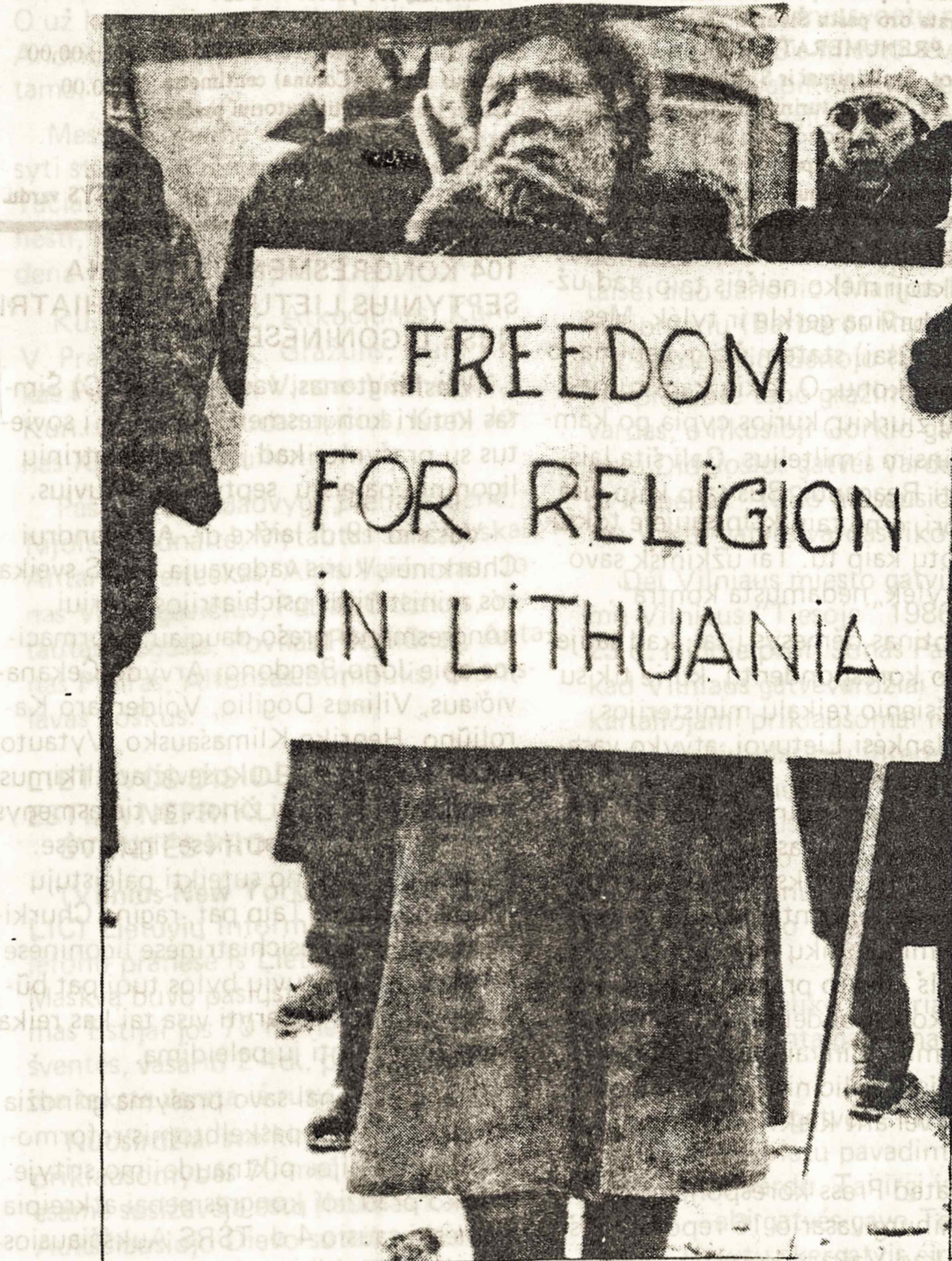
Prie Sovietų Sąjungos ambasados Otavoje 1988 m. vasario 13 d. moteris reikalauja religijos laisvės Lietuvoje. Šią nuotrauką atspausdino dienraštis “The Ottawa Citizen” 1988.II.15 laidoje

Vilniaus šaltiniai tvirtina, kad milicininkai ir draugovininkai palyginus santuriai laikėsi prie Šv. Onos bažnyčios ir Gedimino aikštėj, nors ir ten pasitaikė incidentų: tai į šiukšlių dėžes sumetė žmonių suneštas gėles, ir pan. Bet mažesnė