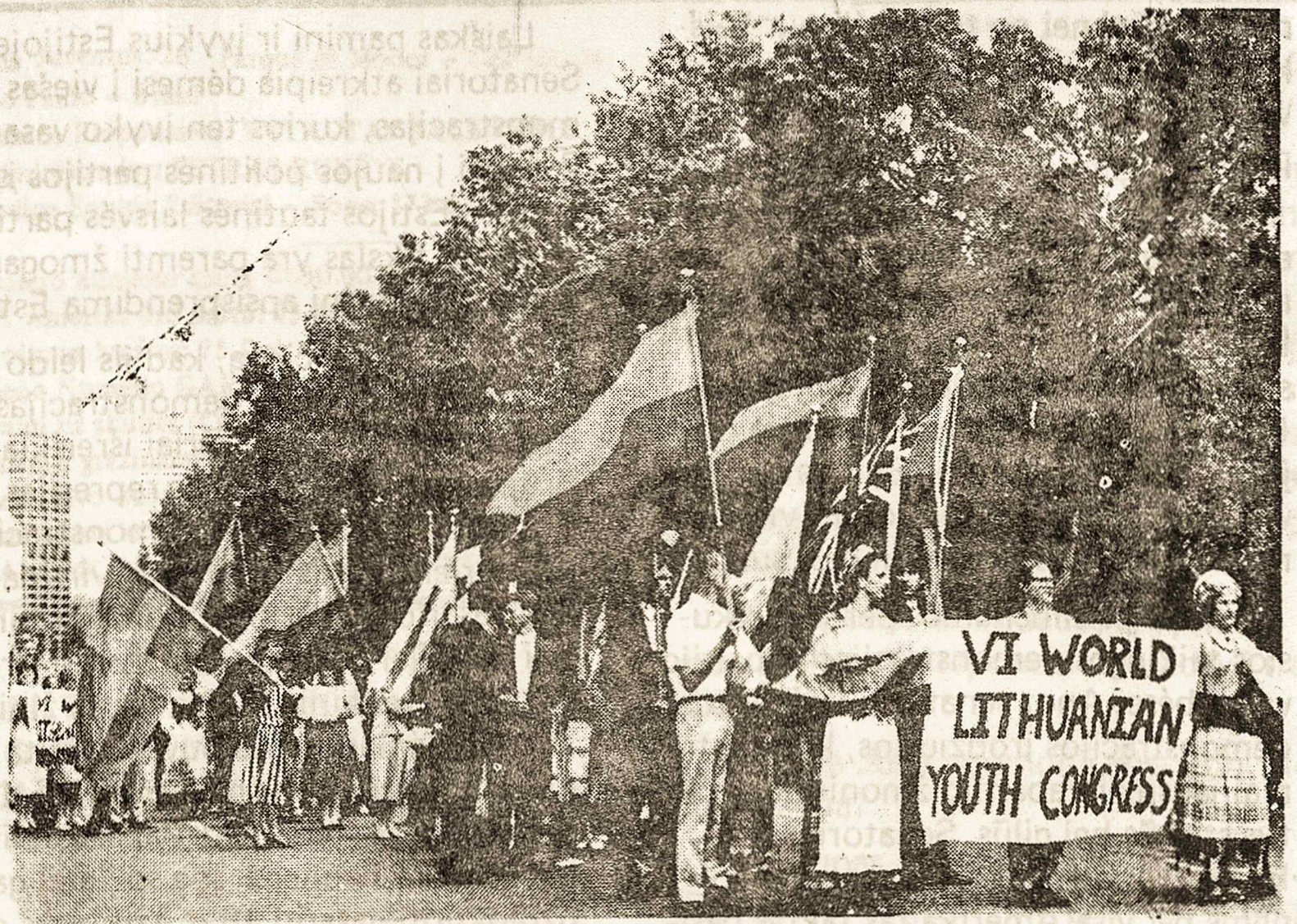
VI-tojo pasaulio lietuvių jaunimo kongreso dalyviai eisenoje Sidnejuje, Australijoje.

atstovų tarpe iš 116 buvo net 24 buvę Vasario 16 gimnazijos mokiniai.