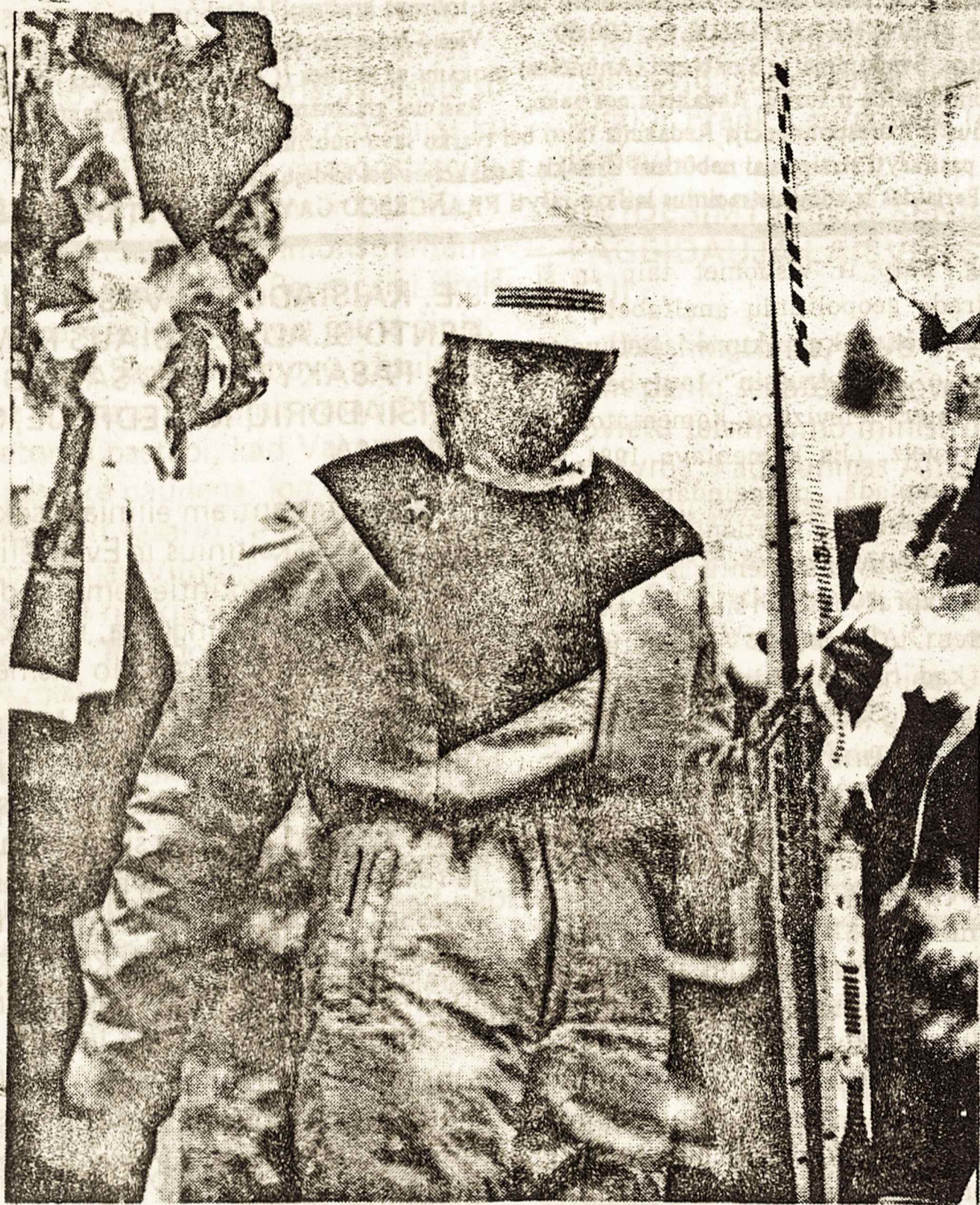
VIDA MOGENYTĖ-VENCIENĖ, laimėjusi aukso medalį olimpinėse žaidynėse Kalgaryje už slidinėjimą 10 km rungtyje ir bronzos medalį 5 km rungtyje

Matydami tokius jaunimo žygius ne tikai Kanadoje, bet ir kituose kraštuose, galime tik pasidžiaugti jo laimėjimais Lietuvos laisvinimo fronte. Kyla betgi klausimas, kas paskatino jaunimą tokiam žygiui. Ar tai vyresniosios kartos idėja? Anaipol. Tai, mūsų žiniomis, paties jaunimo iniciatyva. Jos užuomazga buvo naktinis budėjimas prie Toronto katalikų katedros minint Lietuvos krikščionybės sukaktį. Iš jos išriedėjo ir ta grupė, kuri badavo Otavoje (žymi dalis buvo pirmosios grupės nariai). Žinant tos grupės nuoseklumą, galima įžiūrėti jos dvasinį giminingumą su dabartiniais laisvės kovotojais okupuotoje Lietuvoje, kur dašiai reikišėsi Nijolė Sadūnaitė ir jos vienmičiai. Anksčiau kai kam atrodė, kad jų kova ribojasi religijos laisve. Bet tai buvo klaidinga nuomonė. Kova viename fronte nereikiška atsisakymo kitų frontų. Dabar aiškiai matyti, kad okupuotojo krašto laisvės kovotojams rūpi visuotinė Lietu-