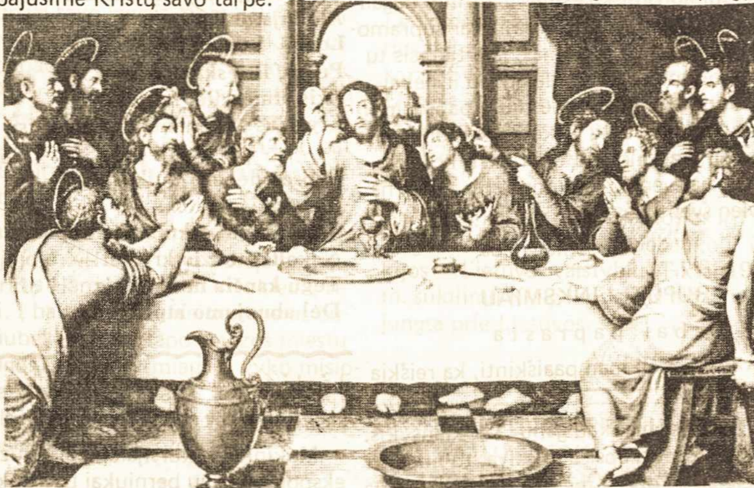
Švč. Sakramento įsteigimas. Juan de Juanes

Nereikia daug dairytis, kad pamatyti Kristų. Jis yra mūsų tarpe. Velykų laikotarpyje prisiminkime Paskutinės Vakarienės Taurę ir paskyrę vargšui savo dalį pajusime Kristų savo tarpe.