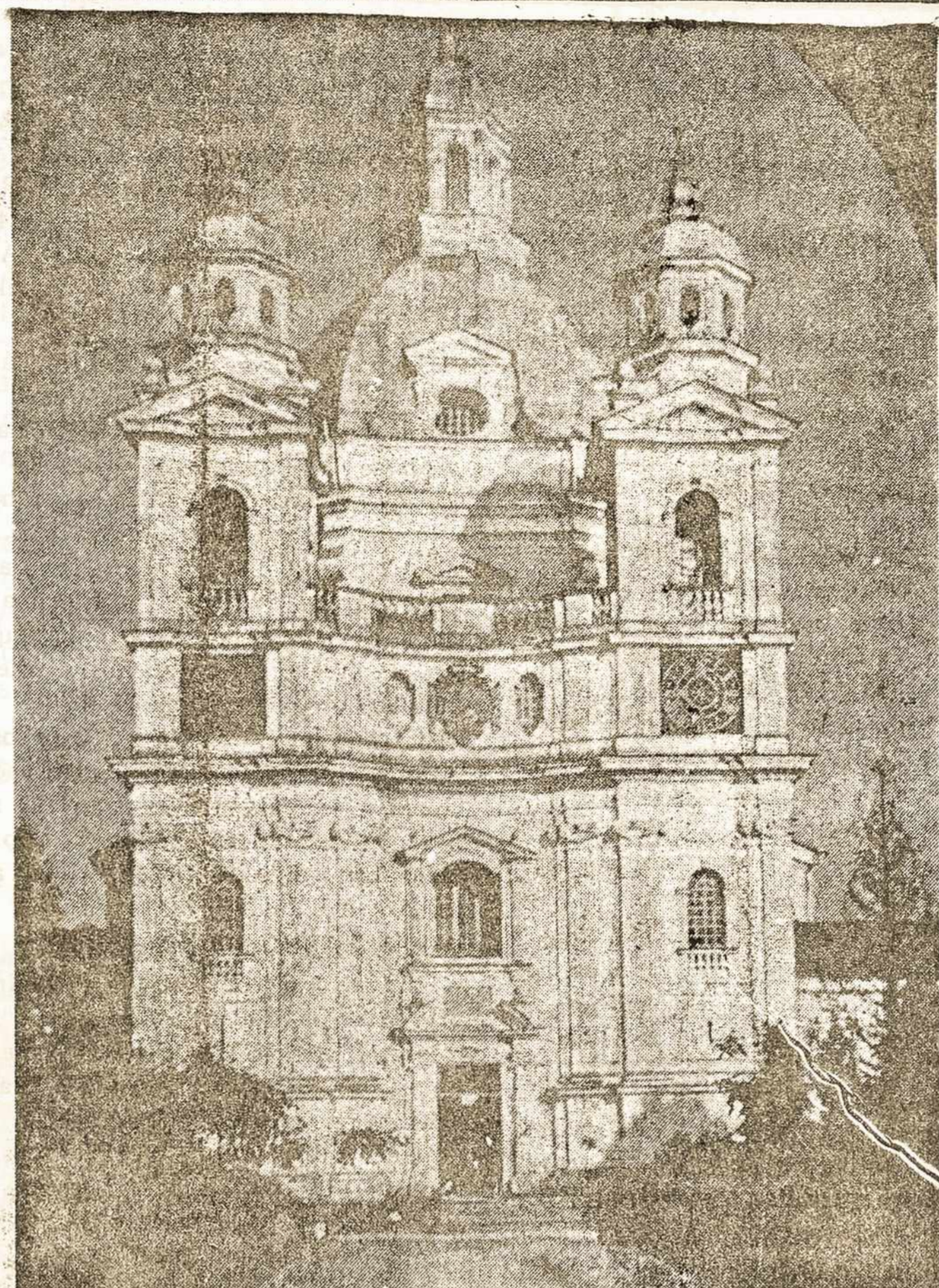
Pažaislio bažnyčia, XVII amžiaus architektūrinis šedevras, šiandien, kaip ir daugelis kitų bažnyčių, suprofanuota