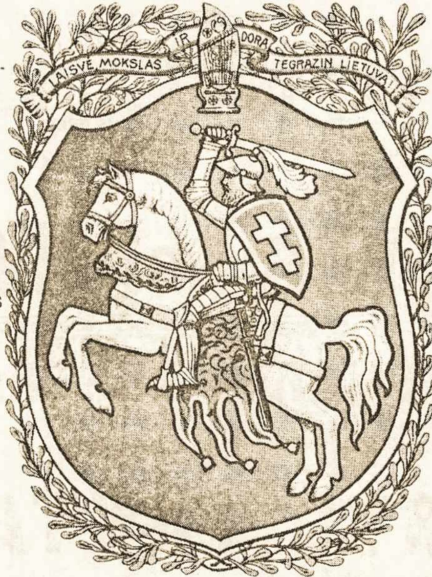
Senas Lietuvos vytis, nupieštas dar prieš I-mąjį karą. Viršuje įrašyta "Laisvė, mokslas ir dora tegražin Lietuvą!"