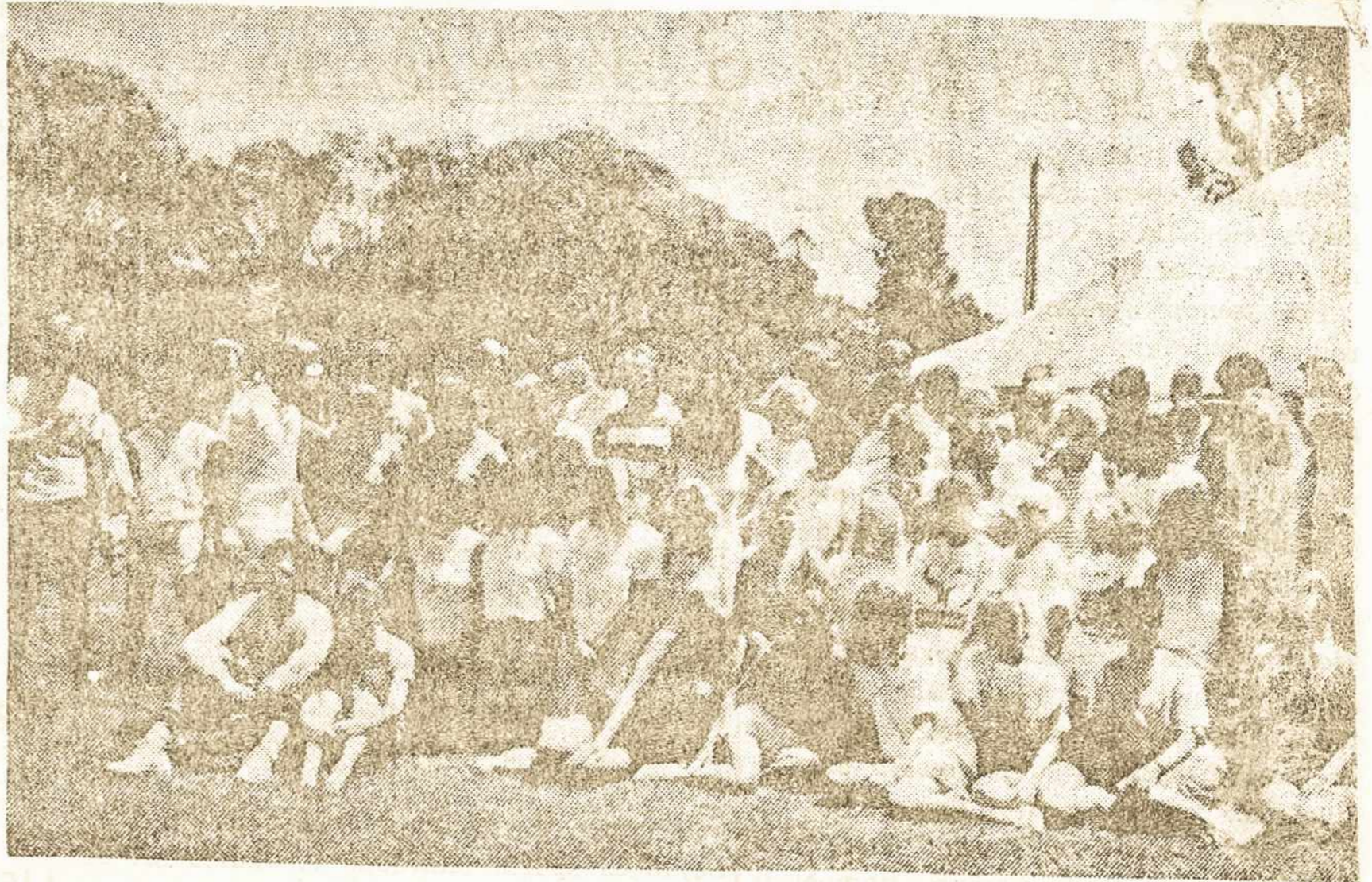
JAV atstovai ir dalyviai PLJK stovykloje Adelaidėje Australijoje.

Senieji tamsiaodžiai australai čia beveik sunaikinti. Jų vietoje susiformavo ar tebesiformuoja baltųjų ateivių Australijos nacija. Angliškas nacionalistinis nusiteikimas, visiška ūkinė D. Britanijai priklausomybė išliko ir po 1901 m., su-