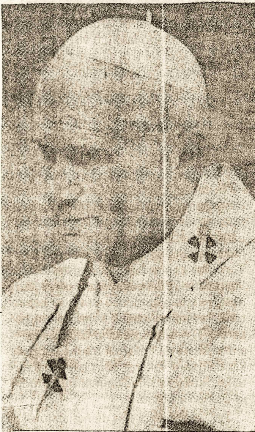
Popiežius JONAS PAULIUS II

Jūsų sielovadinio darbo srityje krepiau ypatingą dėmesį į jūsų iškeltus klausimus. Jūs priminėte prieš 5 m. mano išreikštą linkėjimą, kad visos Lietuvos vyskupijos turėtų po savo vyskupą. Užtikrinu, kad Šv. Sostas yra išbandęs visas galimybes šioje srityje. Jūs nešate didelę atsakomybę bendruomenėje, kuri tampa vis sudėtingesnė ir pilna nerimo. Dėl to