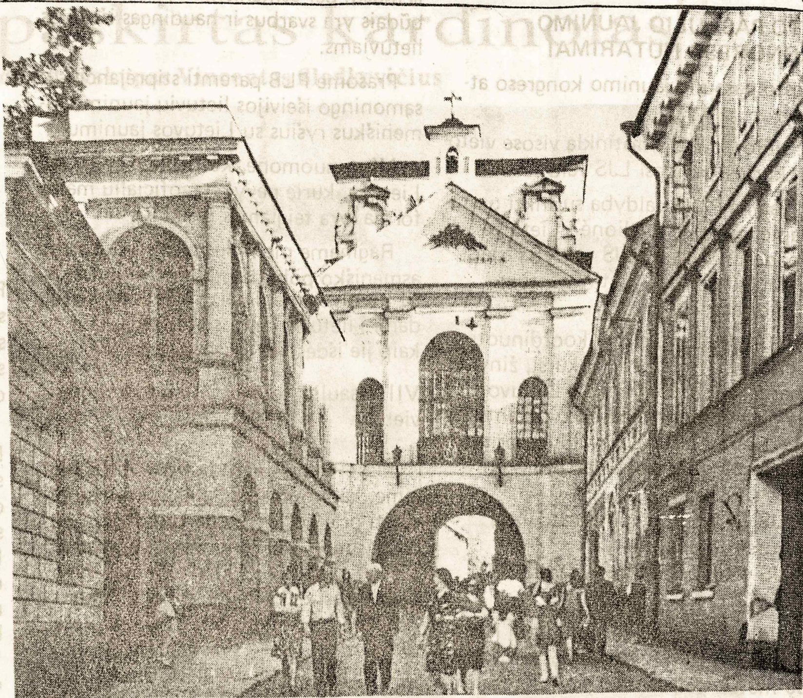
Aušros Vartai Vilniuje. Stebuklingasis Marijos paveikslas yra pačiame centre už didžiojo stiklinio lango

Bet kai, protestantizmui kilus Vokietijoj, prūsai, latviai ir estai tapo protestantais ir tokių būdu atmetė Marijos