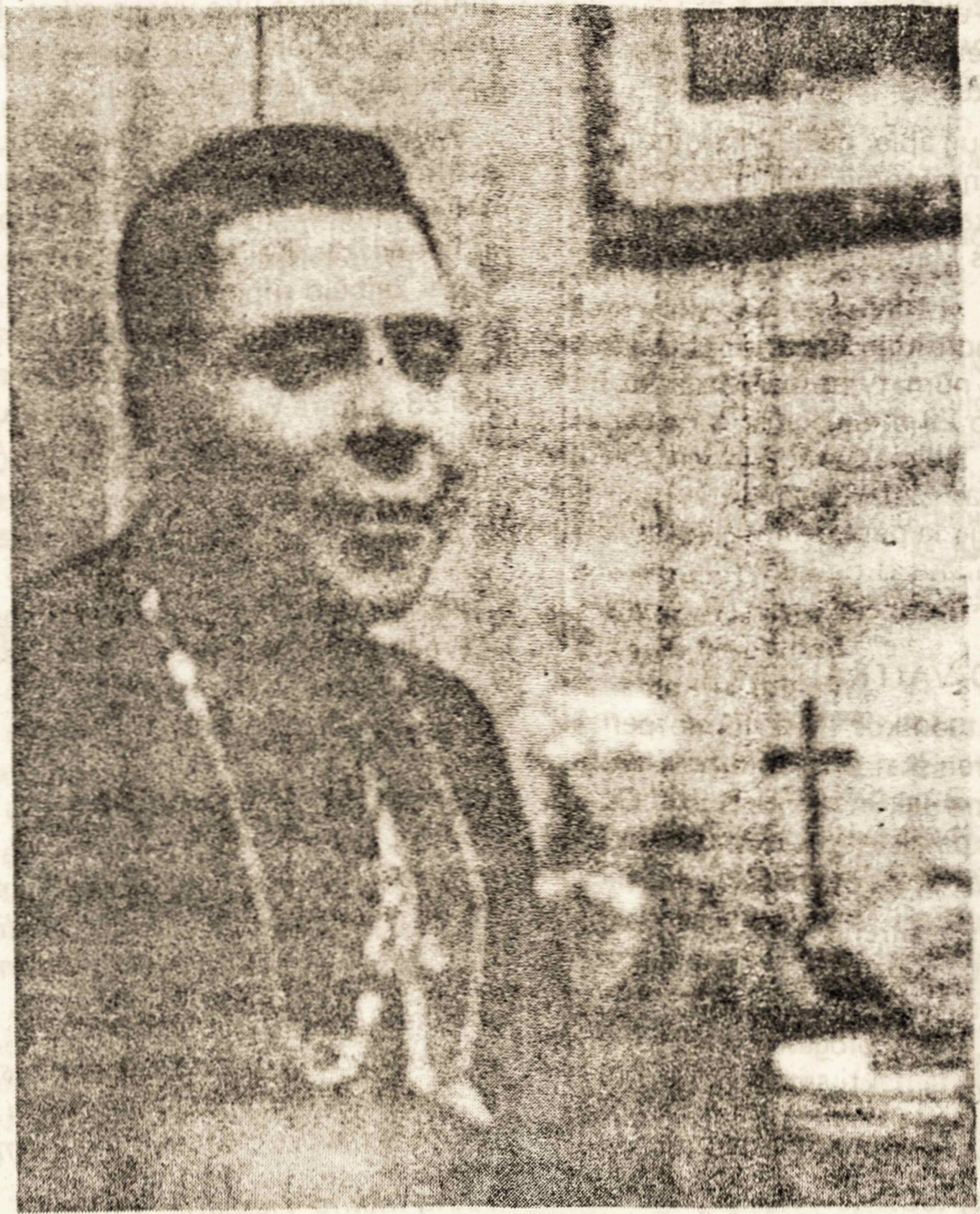
Naujasis Lietuvos kardinolas Jo Eminencija VINCENTAS SLADKEVIČIUS

Suradęs galimybę pasiūsti į Vatikaną savo kandidatų sąrašą kitais keliais, vysk. T. Matulionis susilaukė atsakymo: jis buvo gautas paštu vysk. K. Paltaroko